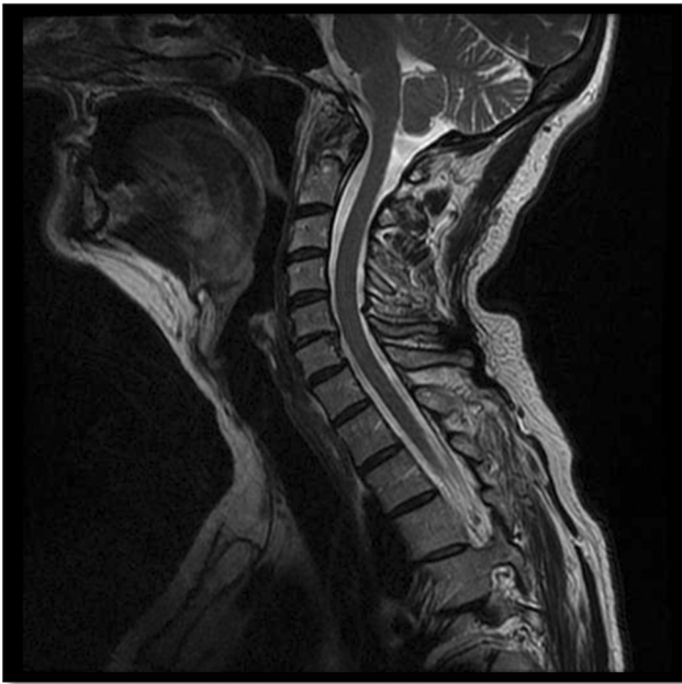
Fig. 1 Imagen de RM en que no se informa de hallazgos sugestivos de patología en las vértebras C1-C2.

resonancia magnética (RM) y de un electroneurograma (ENG). La RM nos informó de la existencia de pinzamiento de C5-C6 con retrolistesis, pero sin afectación del canal medular, y en el ENG no se encontraron repercusiones axonales de los miotomas C5-C6. Ante la aparente cervicalgia convencional, se derivó la paciente al Servicio de Rehabilitación, en el que fue recibida a los ocho meses del inicio de los síntomas (► Figura 1 )