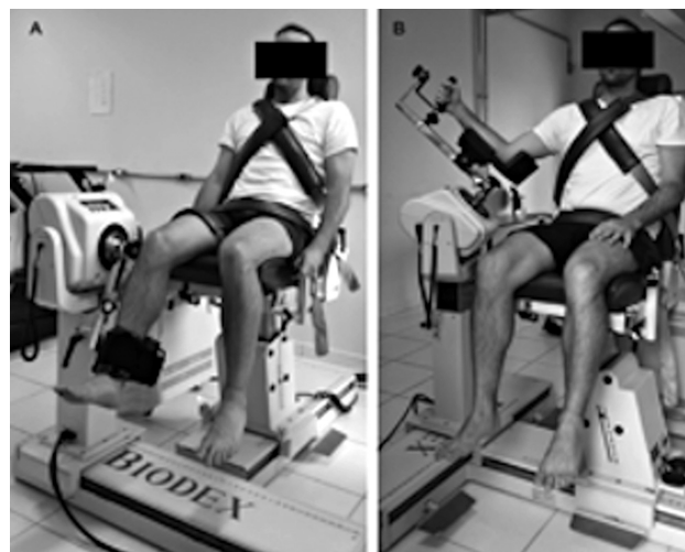
Fig. 1 Avaliação isocinética de joelho e ombro.

No 3° dia, os atletas sentaram-se na cadeira isocinética e o examinador posicionou o ombro dominante a 60° de abdução e 30° de adução horizontal (plano escapular), com o cotovelo em 90° de flexão 19 (►Fig. 1b). Cintas estabilizadoras foram fixadas na pelve e no tronco. A ADM do ombro foi limitada em 90°, começando com 50° de rotação interna (RI) e terminando em 40° de rotação externa (RE), considerando 0° como o antebraço em posição horizontal. A razão entre rotadores internos e rotadores externos foi determinada em 60°/s e 360°/s, e o índice de fadiga em 360°/s. 19 Seis atletas não compareceram à avaliação isocinética do ombro realizada no 2° dia (por motivos pessoais). Portanto, 43 atletas (média \pm DP de idade, 21,30 \pm 4,19; estatura, 1,96 \pm 0,06; e massa corporal, 89,98 \pm 8,83) foram submetidos ao teste isocinético de ombro.