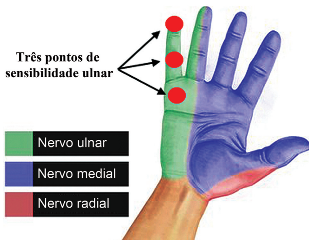
Fig. 1 Os três pontos de sensibilidade inervados pelo nervo ulnar (círculos vermelhos).

O desempenho motor ulnar foi medido: 1) no músculo abductor do quinto dedo (abductor do dedo mínimo), 2) no primeiro músculo interósseo dorsal; 3) nos músculos interósseos e lumbricais do quinto dedo. Os valores variam entre M0 e M5; sendo que M0 indica paralisia completa, M3, ação