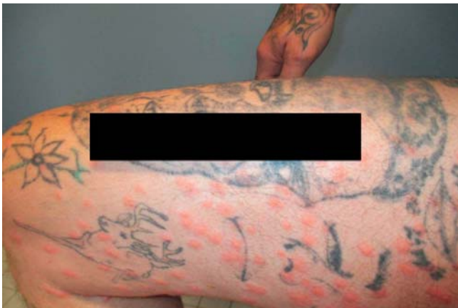
► Abb. 2 Detailaufnahme rechter Oberschenkel.