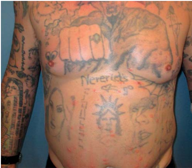
► Abb. 1 Disseminierte Papeln am gesamten Integument.