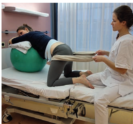
Abb. 13 In der Wehenpause sollte sich die Frau auch in Vierfüßler-Position gut ausruhen können. Auf dem Ball wird ihr Oberkörper gut gelagert. Die Hebamme kann zusätzlich versuchen, die Anspannungen im Becken durch ein leichtes Schütteln zu lockern. Hierfür eignet sich ein über die Leisten gelegtes Tuch (Rebozo), welches leicht hin und her bewegt wird.