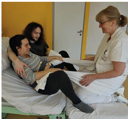
Abb. 4 Die Hebamme kniet auf einem festen Kissen vor der Frau im Gebärbett und reicht ihr ein Laken/Tuch zum Festhalten. Kann die Frau mit den Händen in die gleiche Richtung ziehen, in die sie das Kind schiebt, wird ihr das Mitdrücken sehr erleichtert.

Abb. 2 Zum energetischen Mitdrücken zieht die Frau mit einer oder beiden Händen ihren Partner zu sich ins Bett. Ihre Füße kann sie gut anstemmen, wenn sich (wie hier) das Fußteil des Bettes schräg stellen lässt.