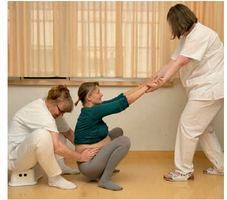
Abb. 22 Äußerer Beckendruck in tiefer Hocke: Wenn die Hebamme auf einem Hocker hinter der Frau sitzt, kann sie mit ihren Beinen die Kraft der Arme beim Drücken unterstützen.

vergleichen in der Fachliteratur bezüglich der Indikationen, Kontraindikationen und empfohlenen Technik. Der Druck auf den Fundus erfolgt immer langsam ansteigend und wehensynchron. Die Technik kann mit zwei flach aufgelegten Händen [4, 23] (Abb. 23), oder mit einer Hand [5, 24, 25] (Abb. 24) oder mit dem Unterarm [26, 27] durchgeführt werden.