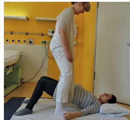
Abb. 16 Das angehobene Becken wird zunächst leicht hin und her geschaukelt. Zur Optimierung der kindlichen Stellung kann dann das Becken im Tuch von der einen zur anderen Seite gerollt werden.