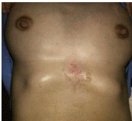
Abb. 26 Sichtbare Hautverletzung nach Anwendung des Kristeller-Handgriffes mit dem Unterarm am 6. Tag post partum.