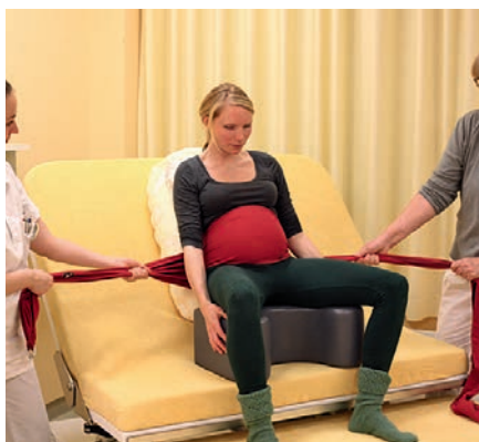
Abb. 6 Ein Tragetuch (mexikanisch: Rebozo) wird über die oberen 2/3 des Bauches gelegt und hinten am Rücken der Frau gekreuzt. So kann es während der Wehe zur Verstärkung der Bauchmuskeln langsam zugezogen werden. Die Anwendung ist auf dem Gebärhocker, im Bett und in Vierfüßler-Position möglich.