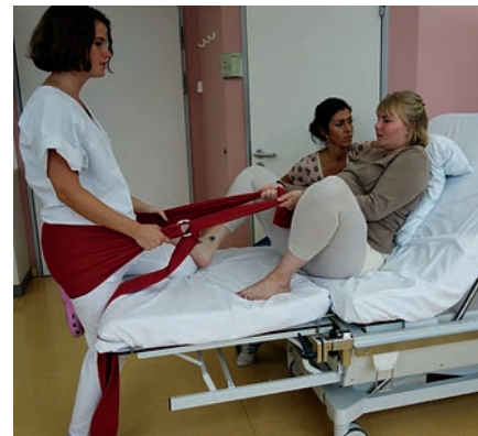
Abb. 11 Steht die Hebamme mit einem Bein vor und mit einem Knie im Bett, kann die Gebärende einen Fuß auf ihren Oberschenkel stellen und so in asymmetrischer Haltung mitdrücken. Eine passend eingestellte Ring-Schleufe (oder ein Bettlaken) um das Gesäß der Hebamme ermöglichen hier ein Ziehen und Mitschieben in die gleiche Richtung.