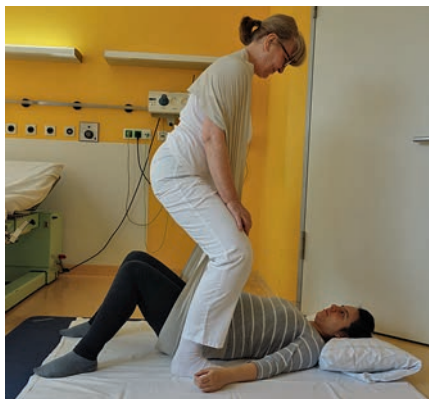
Abb. 15 Das Schaukeln und Rollen des Beckens in einem Tuch (hier Ring-Schleufe nach Harder) lockert Rücken, Iliosakralbereich und den Beckenboden. Die meisten Frauen empfinden das als sehr wohltuend und lassen sich gerne über mehrere Wehen-Pausen (einige auch während der Wehe) hin und her rollen. Zum Anheben muss die Hebamme ihren Rücken ganz gerade halten und die Knie strecken (weiter s. Abb. 16).

Die Anwendung des Kristeller-Handgriffs (Uterine Fundal Pressure) wird kontrovers diskutiert. Die Beschreibungen di-