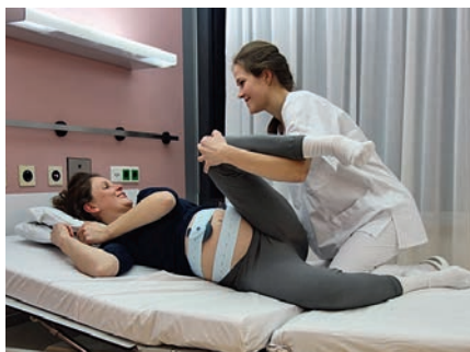
Abb. 18 Beckenmobilisation Seitenlage während der Wehe zur Erweiterung des Beckenausgangs: Die Hebamme kniet mit einem Bein im Bett, sie legt sich Unterschenkel und Knie der Frau auf den Arm und drückt ihr dieses an den Körper – optimal bei der Ausatmung (weiter s. Abb. 19).