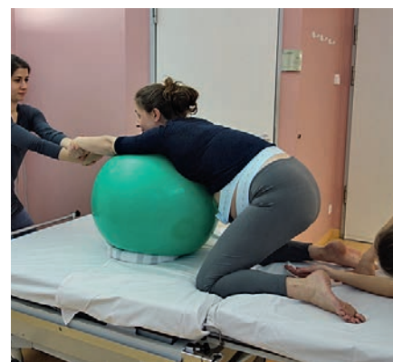
Abb. 14 Zum Mitschieben in Vierfüßler-Position wird das Bett etwas von der Wand zurückgezogen. Die Begleitperson stellt sich hinter das Kopfteil des Bettes, damit die Frau an ihren Armen ziehen kann, um besser mitdrücken zu können. Damit der Ball nicht vom Bett rollt, liegt er auf einem zum Ring geformten Handtuch.