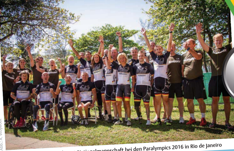
Die deutsche Radsport-Nationalmannschaft bei den Paralympics 2016 in Rio de Janeiro