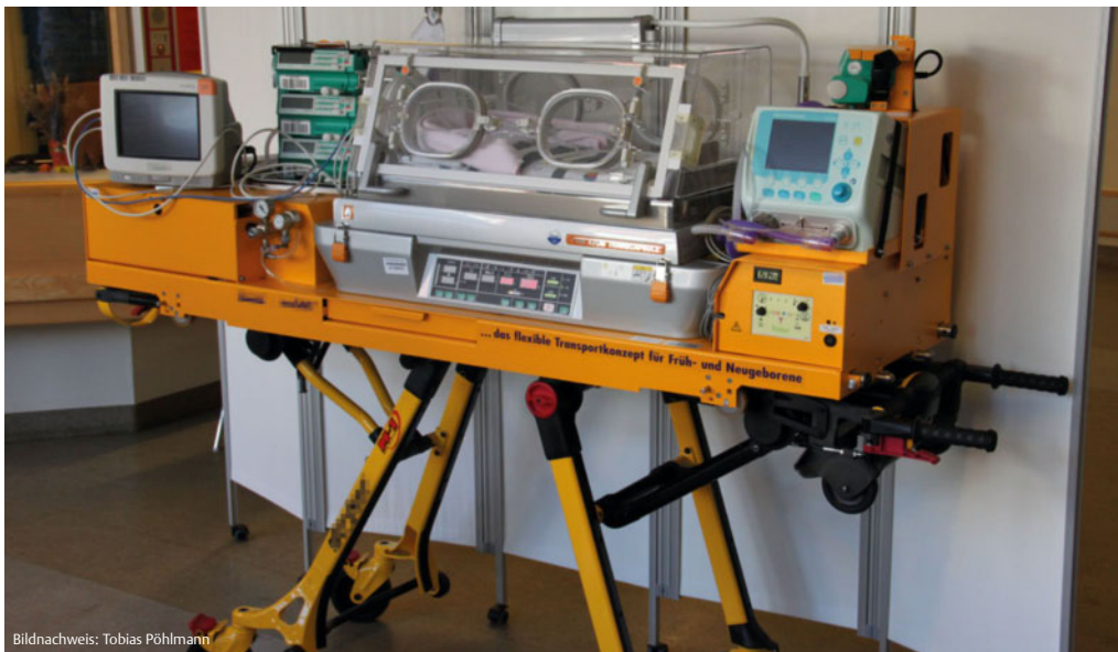
Abb. 2 Intensivtransport-Inkubator.

Ankunft des Notarztes zeigte das Kind eindeutige Lebenszeichen, sodass entsprechend den ERC-Guidelines zur Neugeborenenreanimation und -versorgung vorgegangen wurde (ERC = European Resuscitation Council) [4]. Hierzu gehört als wesentliche Maßnahme die initiale Belüftung der Lungen und die Durchführung von 5 Beatmungen, die alleine meist zu ausreichender Oxygenierung, Einsetzen der Spontanatmung und Zunahme der Herzfrequenz führt. Im aktuellen Fall kommt erschwerend die fehlende Lungenreife des Neugeborenen hinzu, die normalerweise mit Bildung von Surfactant ab der 28. SSW erreicht wird.