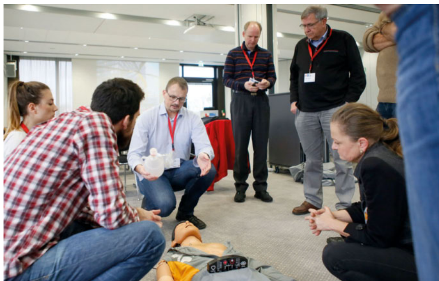
Die MEDICA EDUCATION CONFERENCE bietet ein internationales Fortbildungsprogramm, das mit dem Besuch der MEDICA ergänzt werden kann.

* Die Teilnehmerzahl der Kurse mit internationalem Zertifikat ist begrenzt. Ihre Teilnahme ist kostenpflichtig und bedarf einer separaten Anmeldung. Die Karten sind im Vorverkauf seit August unter www.medica.de/1130 erhältlich. Die anderen Kurse sind im Preis der Tageseintrittskarte für die Konferenz inbegriffen.