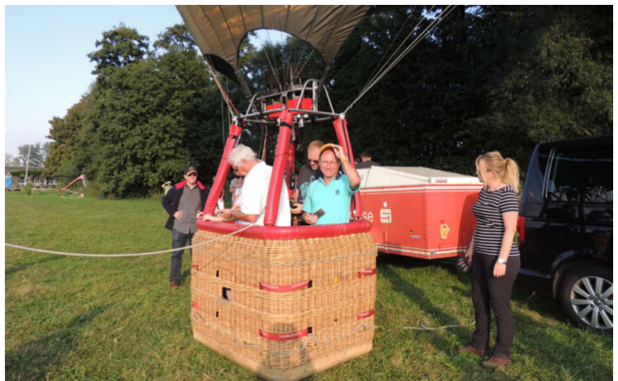
Abb. 3 Impressionen vom Flugtag.