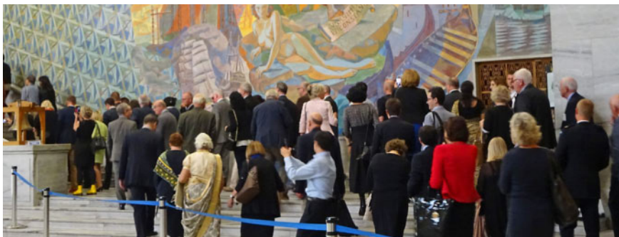
Abb. 4 Die Teilnehmer der ECAM 5 auf dem Weg zum Empfang im Rathaus von Oslo.