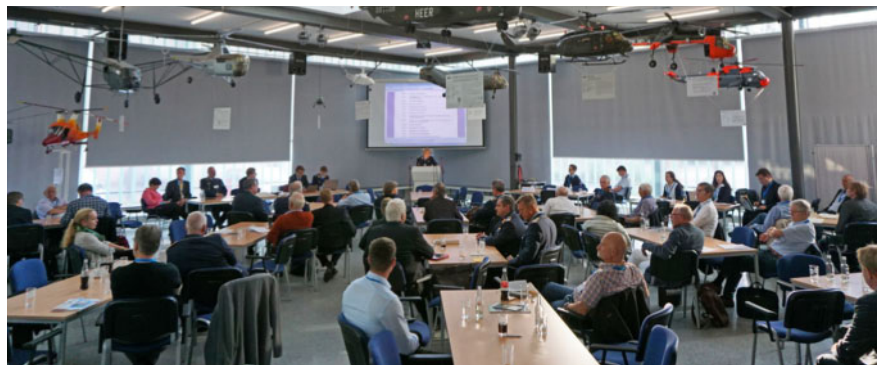
Abb. 9 Blick in die Mitgliederversammlung der DGLRM.