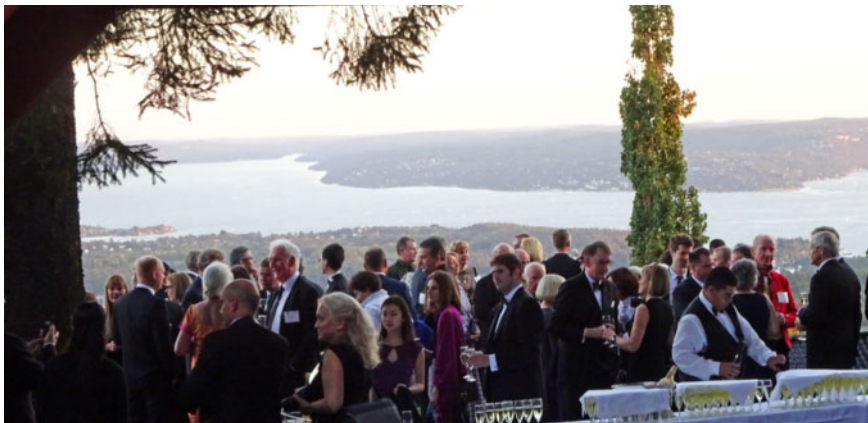
Abb. 6 Eröffnung des Abschlussabends im Hotel auf dem Holmenkollen in Oslo.