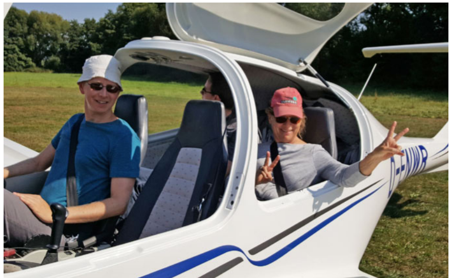
Abb. 2 Impressionen vom Flugtag.