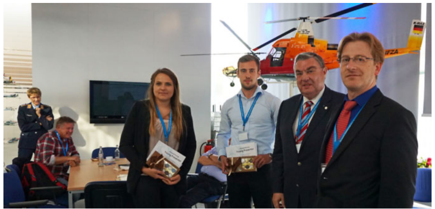
Abb. 8 Vergabe der First-Presenter-Preise an junge Wissenschaftler.

Die diesjährige Jahreshauptversammlung unserer Gesellschaft (Abb. 9) war so gut besucht wie schon seit Jahren nicht mehr und stand vor allem im Zeichen der Neuwahlen zum Vorstand und Vorstandsrat sowie von Diskussionen über die zukünftige Gestaltung der zivilen flugmedizinischen Ausbildung in Deutschland und der Rolle, die die DGLRM dabei einnehmen soll. Daneben standen die Rechenschaftslegung des Vorstands und der Arbeitsgruppenleiter über die im letzten Jahr geleistete Arbeit sowie ein Beschluss zur Erhöhung der Mitgliedsbeiträge ab dem