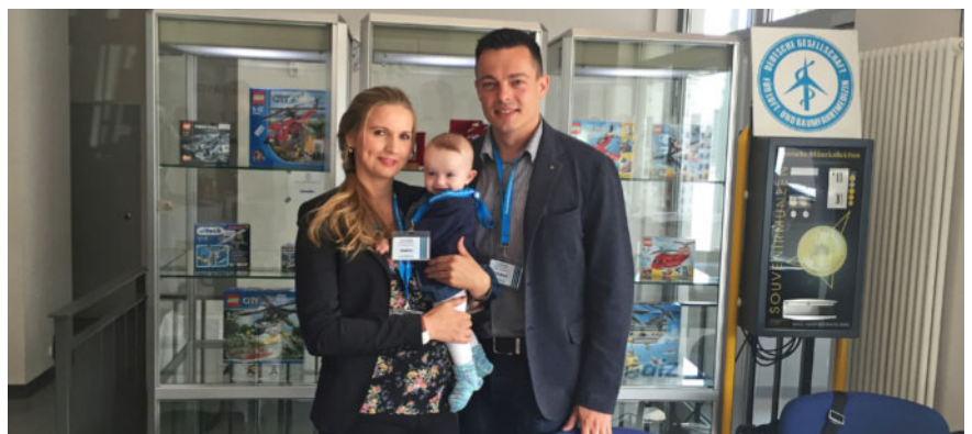
Abb. 11 Unser Organisationsteam – Wir beginnen schon sehr früh mit der Nachwuchsgewinnung.