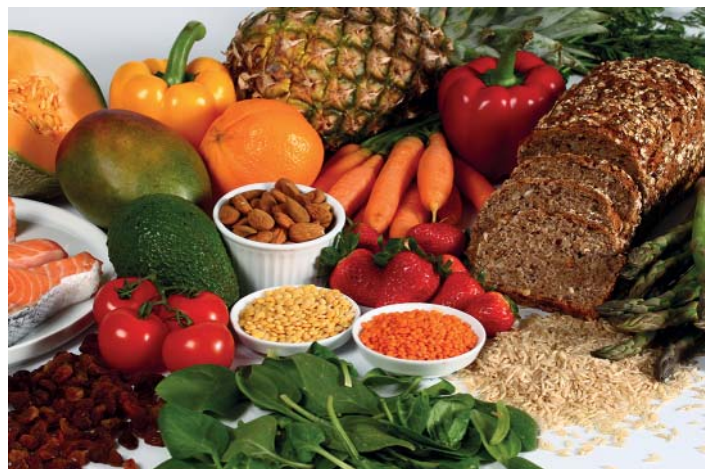
► Abb. 1 Eine vollwertige Ernährung reich an Obst und Gemüse in Kombination mit körperlicher Aktivität sollte zur Prävention von Krebserkrankungen empfohlen werden.

Es gilt anzumerken, dass für bestimmte Patientengruppen ein präventiver Effekt durch eine Supplementation von Mikronährstoffen prinzipiell möglich sein könnte [22, 26]. Weiterführende, prospektive Studien