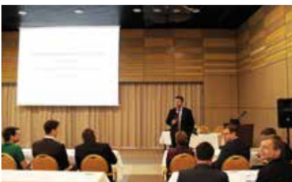
Hochkarätige Referenten machten das Symposium zu einem großen Erfolg.

einbart, die voraussichtlich wieder am letzten Mai-Wochenende stattfinden wird.