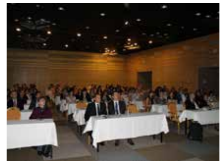
120 Teilnehmer nahmen am Symposium teil.