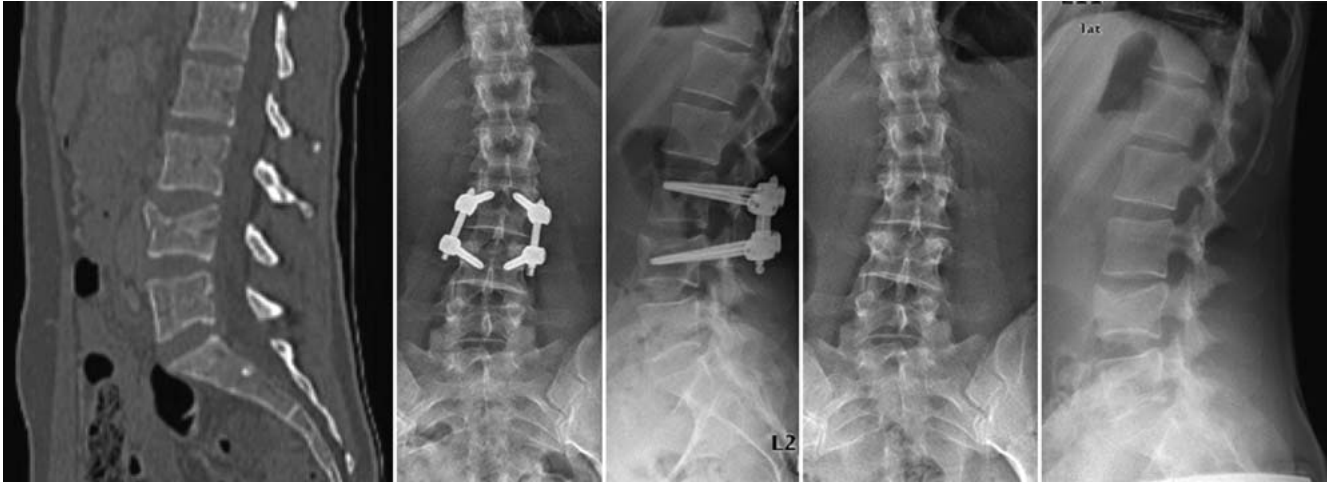
Abb. 3 Fallbeispiel: dorsale monosegmentale Stabilisierung der Lendenwirbelsäule. Die junge Patientin wurde polytraumatisiert nach einem Verkehrsunfall als Fahrradfahrerin u. a. mit einer Kompressionsfraktur des LWK IV in unserer Klinik vorgestellt. Es erfolgte die monosegmentale dorsale Stabilisierung der Fraktur. Nach 6 Monaten konnte die Implantatentfernung erfolgen. Es zeigte sich nur eine geringgradige Minderung der Höhe des Bandscheibenfachs L III/L IV. Subjektiv klagte die Patientin über keinerlei Beschwerden und zeigte eine sehr gute Funktion.

oder Fehllagen der Schrauben und Implantatversagen gesehen werden.