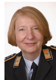
Ich freue mich auf viele interessante Beiträge und grüße Sie, wie immer, aus Fürstenfeldbruck

Bitte reichen Sie Ihre Abstracts für Vorträge und Posterpräsentationen bis zum 31. März 2016 ein! Das Abstractformular finden Sie auf der Homepage. Wie es bei uns bereits langjährige Tradition ist, werden die besten Poster wieder mit Preisen gewürdigt. Weitere Details entnehmen Sie bitte unserer Homepage www.dglrm.de .