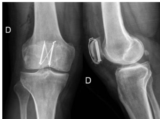
Fig. 2 Radiografías en proyecciones AP y lateral, en que se observa fractura de patela tratada mediante el uso de banda de tensión realizada con asa de alambre por medio de tornillos canulados.

Es fundamental considerar la biomecánica del hueso y el método de fijación a utilizar; en el caso de la patela, el ángulo entre el vector de fuerza del cuádriceps y el del tendón patelar determina que, en flexión, la patela se doble separando los fragmentos, 1 lo que es neutralizado por la banda de tensión, que convierte dichas fuerzas en