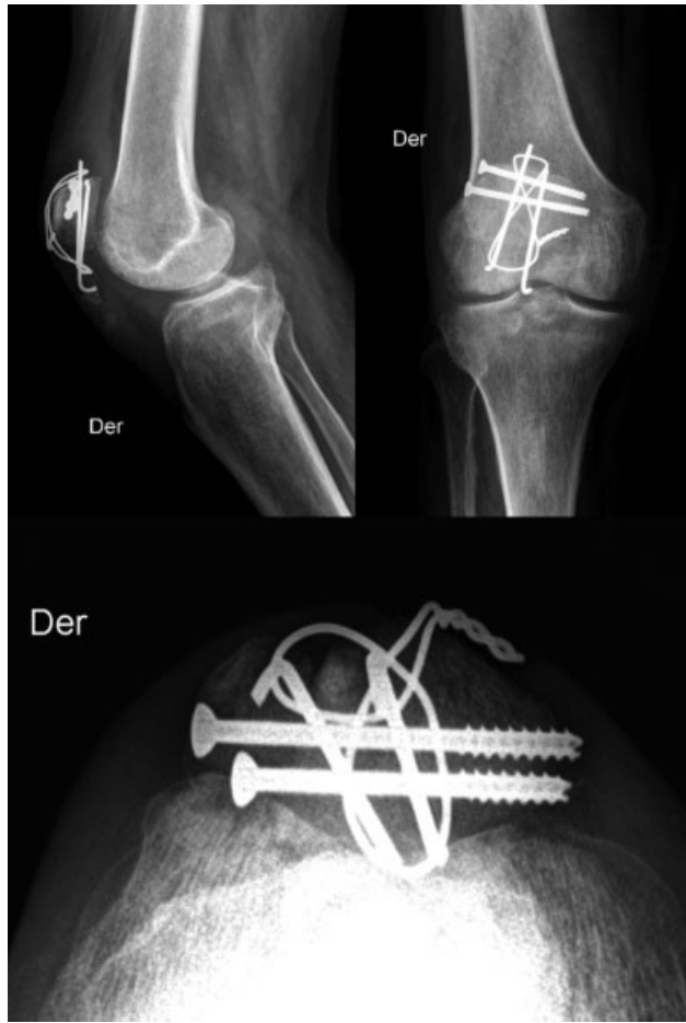
Fig. 3 Imágenes de radiografía de rodilla derecha con fractura de patela tratada mediante banda de tensión con agujas de Kirchner y tornillos canulados. Es visible la protrusión de elementos de osteosíntesis, lo que se correlaciona con la sintomatología referida por el paciente.

compresivas a nivel de la fractura, siendo la variante realizada por medio de tornillos canulados la más estable. 15