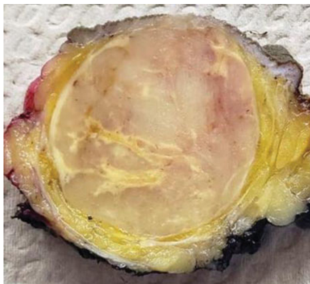
Fig. 3 Aspecto macroscópico de la lesión tumoral inguinal.

El estudio de patología reportó macroscópicamente una lesión superficial de bordes bien definidos recubierta parcialmente por piel (►Fig. 3). En histopatología, se encontró una lesión con sábanas de células pleomórficas mezcladas con células claras xantomatosas (►Fig. 4), sin conteo mitótico alto ni necrosis, y con bordes negativos para tumor. Con estos hallazgos, se plantearon varios diagnósticos diferenciales, que incluyeron: carcinoma sarcomatoide, melanoma, y fibroxantoma atípico (FXA), inicialmente; sin embargo, no hubo contacto con la epidermis, y las citoqueratinas AE1/AE3 - CAM5.2 y las proteínas P.63, P.40, S100, SOX11 y MELAN A fueron negativas, lo que nos hizo descartar el diagnóstico de carcinoma y melanoma. En cuanto al FXA, esta lesión no está en piel expuesta al sol, es muy grande, y comprometió profundamente; por lo tanto, se descartó. Se encontró reactividad difusa para CD34 (►Fig. 5), lo que amplió el espectro de diagnóstico, incluyendo: mixofibrosarcoma (pero usualmente hay vasos