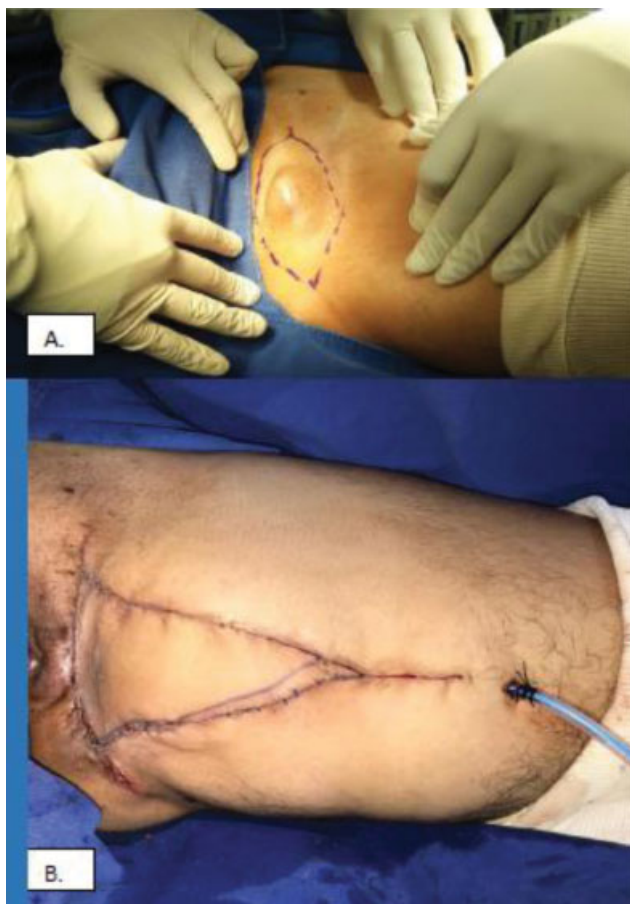
Fig. 2 (A) Masa en región inguinal; (B).resección de lesión y reconstrucción con colgajo local.

de la lesión, hubo dificultad para su clasificación, y se rotuló como un posible sarcoma.