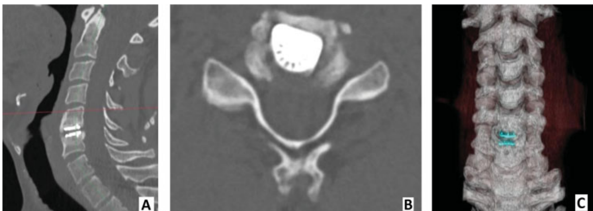
Fig. 2 Tomografías computarizadas (TCs) de OH de grado III (caso clínico anterior): (A) TC sagital; (B) TC axial; (C) TC tridimensional.

Las características de referencia y las puntuaciones de los pacientes se clasificaron en OH clínicamente relevante y no