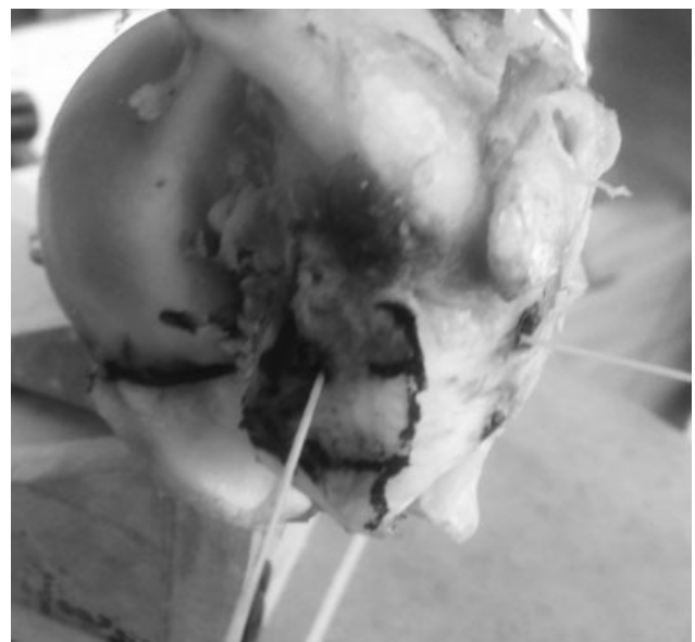
Fig. 3 Disección de la tuberosidad mayor y preparación de los túneles. En esta figura, se observa que todo el tejido blando alrededor del húmero proximal fue removido para identificar la tuberosidad mayor y poder diseñar los túneles.

Para el análisis estadístico, considerando un número bajo de datos, se realizó el test no paramétrico U de Mann-Whitney para evaluar la variable estudiada. Todos los datos fueron analizados usando el programa STATA (StataCorp LLC, College Station, TX, EEUU), versión 16. Se estableció la significancia estadística en p < 0,05 a dos colas.