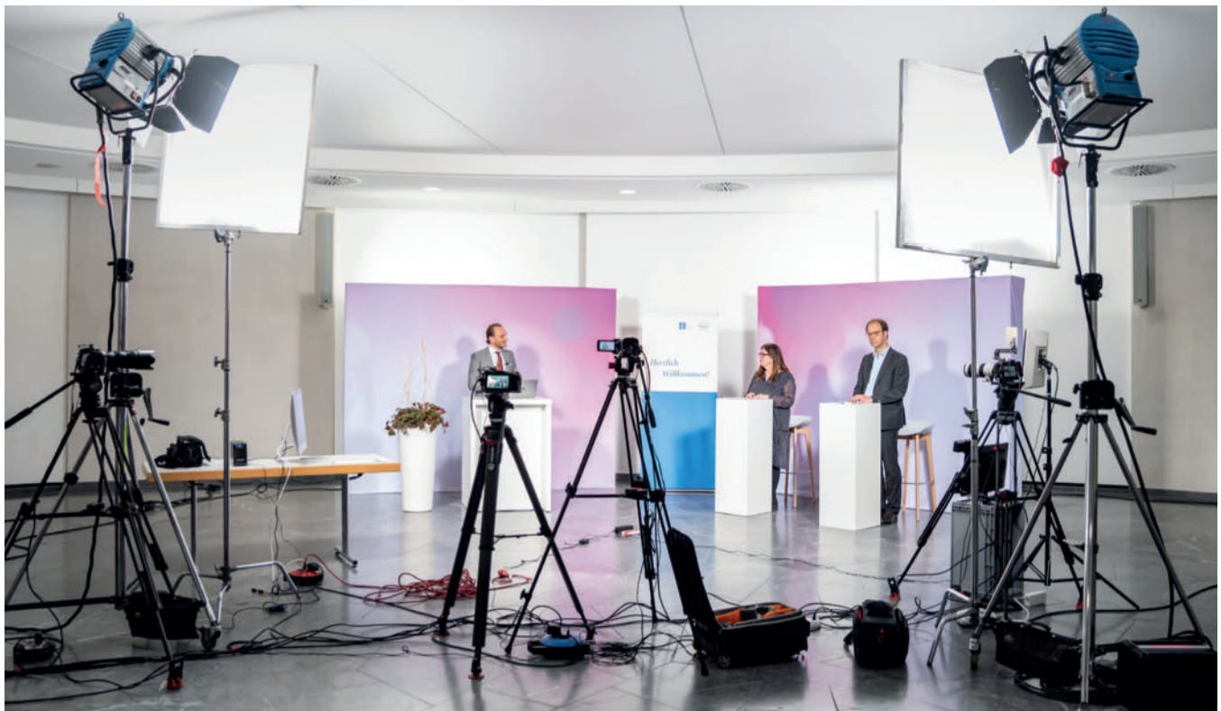
Oben links ist die „Nutzeroberfläche“ der GTH Highlights zu sehen. Die weiteren Bilder zeigen einen Blick „hinter die Kulissen“.