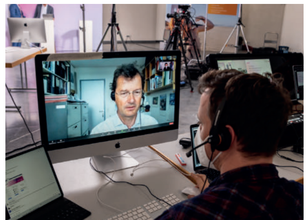
Unsere Technikpartner der FokusPokus Media GmbH waren bereits bei der Planung involviert und ermöglichten vor Ort den perfekten Stream.