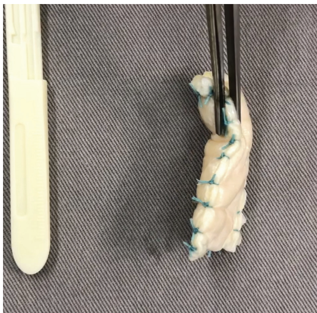
Fig. 1 Aloenxerto de fásia lata com 8 mm de espessura.

foram operados pela técnica artroscópica, sendo o paciente posicionado em decúbito lateral com o braço abduzido a 30°. Em todos os casos, foram realizadas tenotomia do bíceps, bursectomia e acromioplastia. As rupturas subescapulares foram reparadas nos casos de ruptura parcial ou total. Os