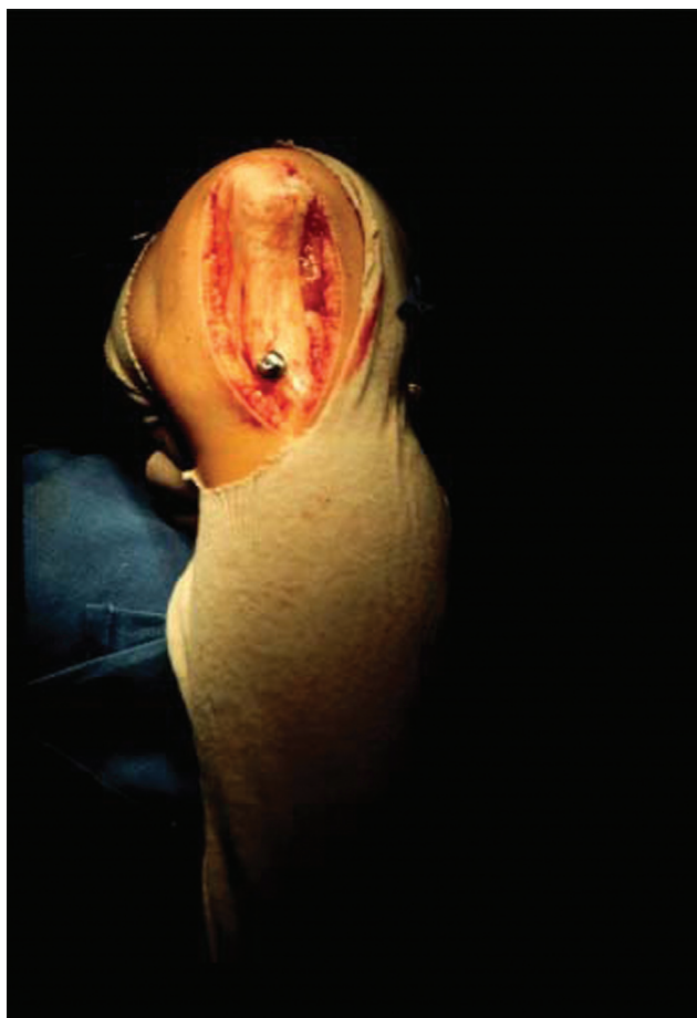
Fig. 3 Medialização da tuberosidade anterior da tibia fixada com um parafuso esponjoso (segundo técnica de Elmslie-Trillat).