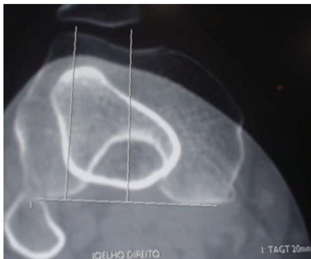
Fig. 1 Corte axial de tomografia computadorizada com medida da distância da tuberosidade anterior da tibia ao sulco troclear de 20mm.

institucional de reabilitação realizado pela mesma equipe. O diagnóstico de instabilidade patelar era confirmado após a avaliação da história, da realização de exame clínico sugestivo realizado por médico experiente em cirurgia do joelho, e por imagem compatível (radiografia e ressonância magnética [RM]).