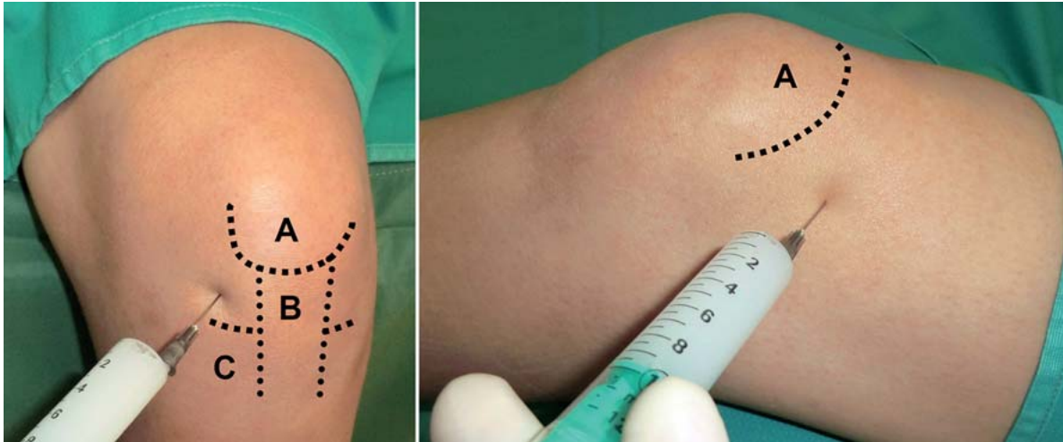
Abb. 2 ■ Intraartikuläre Injektionstechnik am Kniegelenk von anterolateral am sitzenden Patienten (links) und von superolateral am liegenden Patienten (rechts). Die Einstichstelle findet sich bei der anterolateralen Technik (linkes Bild) ca. 0,5–1,0 cm lateral des Lig. patellae und direkt über dem Gelenkspalt. Bei Injektion in den superolateralen Recessus (rechtes Bild) liegt die Einstichstelle auf Höhe des proximalen Patellapols (A = Patella, B = Lig. patellae, C = Tibiakopf) [7].

Bei schmerzhaften, jedoch nicht entzündlichen Phasen der Gonarthrose sind intraartikuläre Glukokortikoide nicht angezeigt. Diabetes mellitus stellt eine relative Kontraindikation für die Glukokortikoidinjektion dar. Die Indikation ist bei schwerer Osteoporose, Eng- und Weitwinkelglaukom sowie bei schwerer Colitis ulcerosa, Divertikulitis oder Enteroanastomosen streng zu stellen.