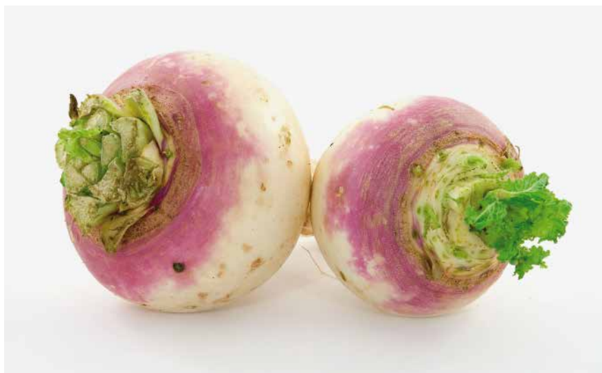
Abb. 3 Rettich.

Am besten wirkt er als Tee v. a. aus der frisch geernteten Pflanze, die man kurmäßig anwenden kann.