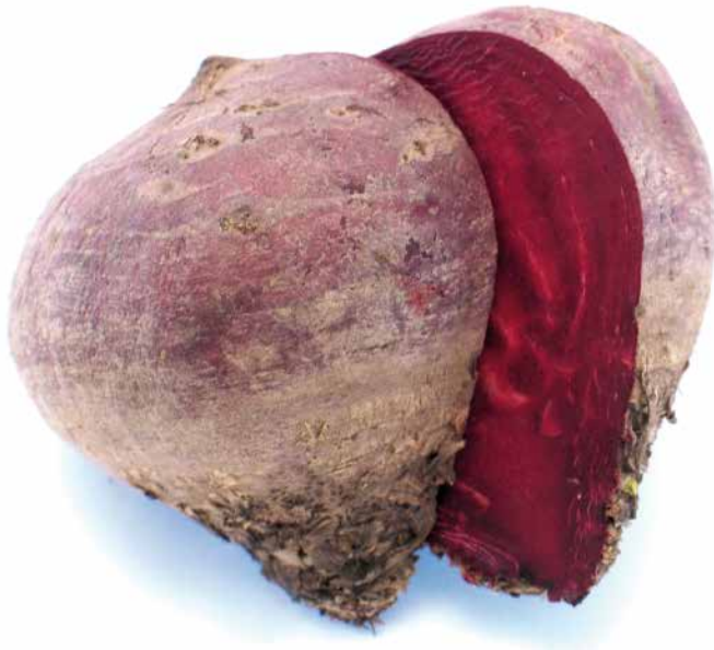
Abb. 2 Beta vulgaris – Rote Bete.

meergebiet ist. Verwendet werden die Laubblätter (Cynarae folium). Die Artischockenblätter enthalten hauptsächlich 3 Substanzklassen: