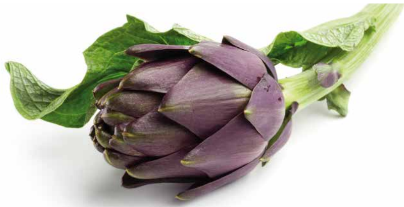
Abb. 1 Cynara scolymus – die Artischocke.

Hier setzt nun eine der wichtigsten Heilpflanzen für die Leber an: die Mariendistel ( Silybum marianum oder Carduus marianus ). Ihren Namen soll sie daher haben, das der heiligen Maria beim Stillen ein paar Tropfen ihrer Milch auf das Blatt gefallen sind und dadurch das Blatt seine marmorierte Farbe erhielt. Die Bezeich-