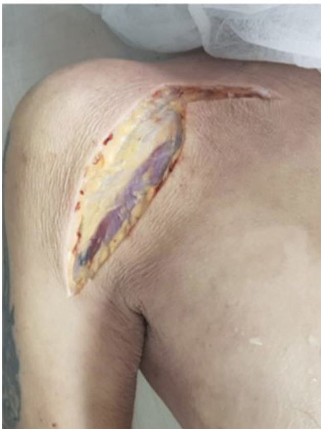
Fig. 1 Via deltopectoral estendida.

Dissecaram-se 26 ombros de 16 cadáveres frescos adultos sem cicatrizes ou deformidades prévias. Todas as disseções foram feitas pelo mesmo grupo de pesquisadores, ortopedistas especialistas em cirurgia do ombro e de forma padronizada, com o cadáver na posição de decúbito dorsal horizontal com um coxim de 15 cm de altura na região interescapular. Iniciou-se a disseção com uma via deltopectoral estendida proximal e em "L", seguindo horizontalmente na direção da articulação esterno clavicular (► Figura 1 - Via).