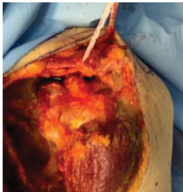
Fig. 6 Realização de tração de 20N após secção dos ligamentos.

O ligamento coracoclavicular medial, também denominado ligamento coracoclavicular anterior de Henle e ligamento coracoclavicular horizontal de Soulié 1,10,12-14 é motivo de controvérsias e há até autores que não o citam na anatomia ligamentar do coracoide. 16 Klassen et al. 8 não o encontraram nas suas dissecções; Rouvière 2 ; Vallois e Thomas 13 não o consideraram uma estrutura própria, mas um espessamento de estruturas vizinhas, isto é, um cordão da fâscia clavipei-