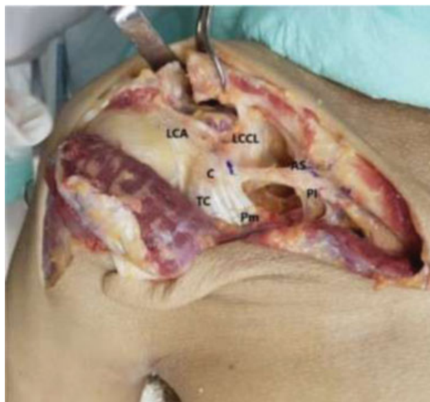
Fig. 2 Disseção, identificação das estruturas e medição do LCCM (Ligamento coracoclavicular medial); LCA: ligamento coracoacromial; C: coracóide; TC: tendão conjunto; Pm: peitoral menor; LCCL: ligamentos coracoclaviculares laterais; AS: banda anterossuperior; PI: banda posteroinferior.

Na primeira parte do trabalho foi realizado um estudo anatômico em 20 ombros de 10 cadáveres para avaliação da morfologia ligamentar do LCCM. Já na segunda parte foi realizado um estudo biomecânico com seis ombros de seis cadáveres, onde foi realizado o seccionamento sequencial dos ligamentos em seis ombros, através da tração cefálica da clavícula, com força de tração constante de 20 N, aplicada a