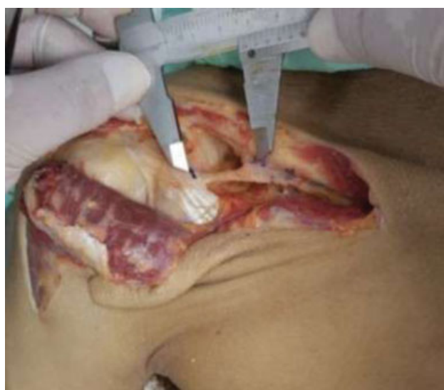
Fig. 3 Disseção, identificação das estruturas e medição do LCCM (Ligamento coracoclavicular medial); LCA: ligamento coracoacromial; C: coracóide; TC: tendão conjunto; Pm: peitoral menor; LCCL: ligamentos coracoclaviculares laterais; AS: banda anterossuperior; PI: banda posteroinferior.

1 cm da borda distal e medida por dinamômetro. A unidade kgF é considerada equivalente à unidade Newton. Foram marcados 3 pontos anatômicos (A,B,C) sendo o ponto A localizado a 1cm do ponto mais medial do acrômio; o ponto B sendo 1cm do ponto mais lateral da clavícula e o ponto C localizado na borda lateral do processo coracoide. A disseção da articulação AC e a transecção de seus ligamentos intrínsecos foram realizadas pela primeira vez; depois, uma secção sequencial dos ligamentos trapezóide e conóide seguidos pelo LCCM. A cada passo, foi aplicada uma força