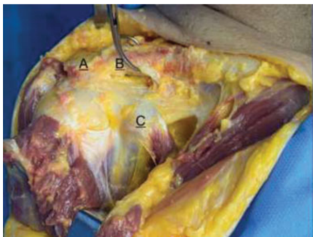
Fig. 5 Pontos A,B e C demarcados.

Avaliamos o deslocamento superior através das distancias AB (acrômio-clavícula) e BC (coracoide-clavícula); deslocamento posterior através da distancia AB (acrômio-clavícula) posterior. Ao medir o deslocamento da clavícula no ponto AB superior, no ponto AB posterior e no ponto BC em quatro momentos distintos (sem lesão dos ligamentos acromioclaviculares [AC] e coracoclaviculares [CC]), lesão AC, lesão AC + CC e lesão AC + CC + LCCM (► Figuras 5 e 6 ), observou-se, em todos os pontos de medição, um aumento significativo do deslocamento, com significância estatística, conforme ► Tabela 3 abaixo: