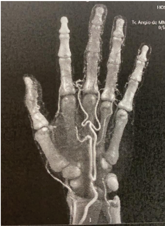
Fig. 2 Angiotomografia mostrando artéria mediana persistente e dominante. Redução da perfusão no 2º dedo.