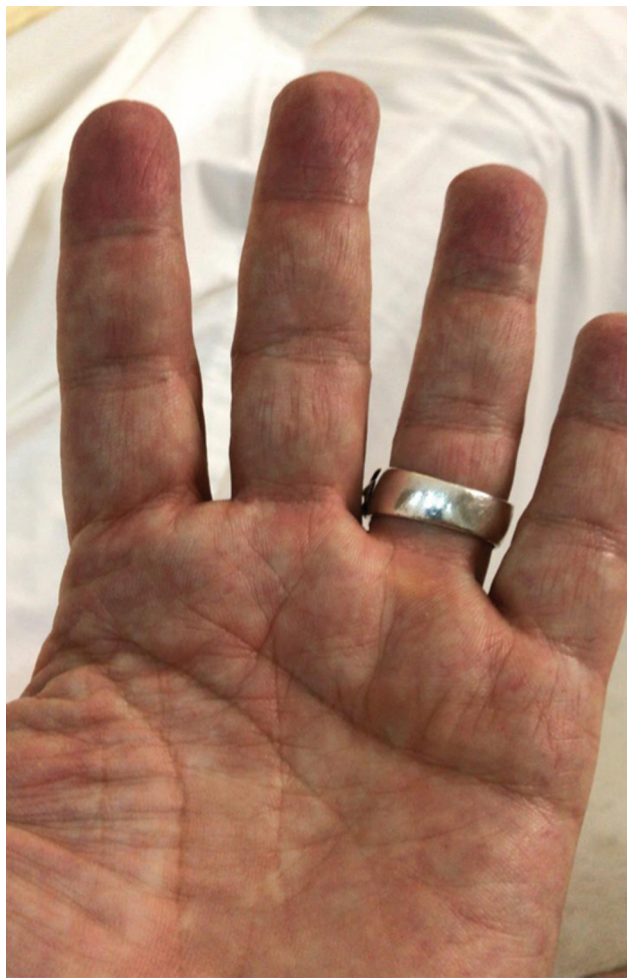
Fig. 4 Perfusão do 2º dedo totalmente reestabelecida após 1 semana da cirurgia.

diagnóstico, o tratamento cirúrgico deve ser instituído, uma vez que o quadro de dor intensa, decorrente da compressão aguda, não costuma reverter-se espontaneamente. 3,6