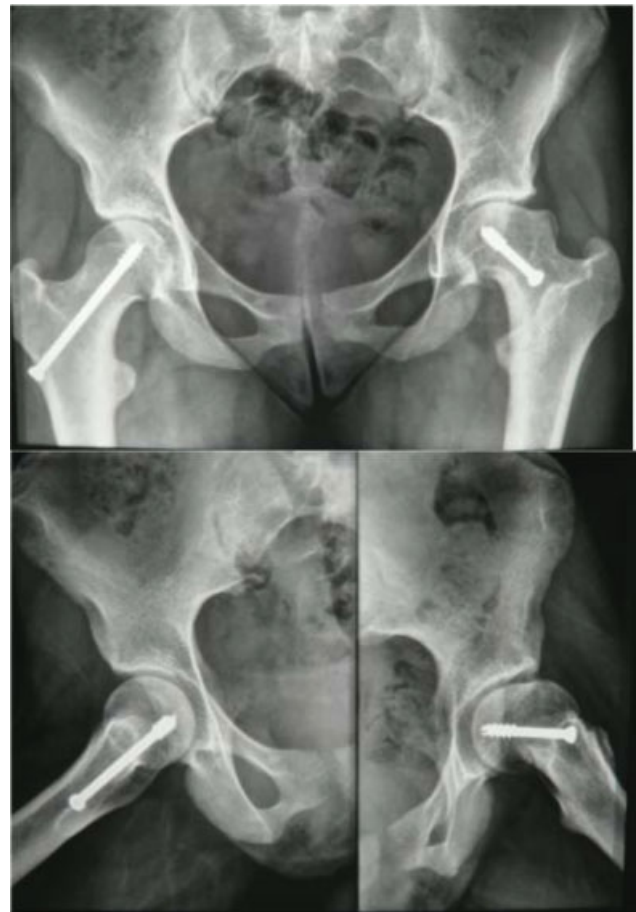
Fig. 1 Radiografias em incidência anteroposterior da bacia (acima) e de perfil de Dunn dos quadris (abaixo) evidenciando deformidade em região anterolateral do colo femoral esquerdo, compatível com impacto tipo came.

Ao exame físico, a paciente apresentava limitação importante da rotação interna do quadril esquerdo associada a quadro álgico durante a manobra. Foi evidenciado sinal de Drennan à esquerda durante o exame. A paciente não apresentava alterações neurovasculares nos membros inferiores, e tinha a força muscular preservada neles.