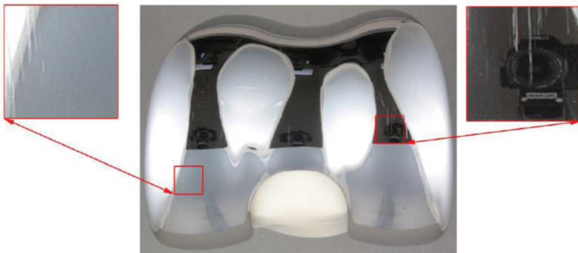
Fig. 2 Análise virtual qualitativa do desgaste.

movimentar rotacionalmente sobre o componente tibial, hipoteticamente diminuindo o atrito e o desgaste do componente. 6,7,12