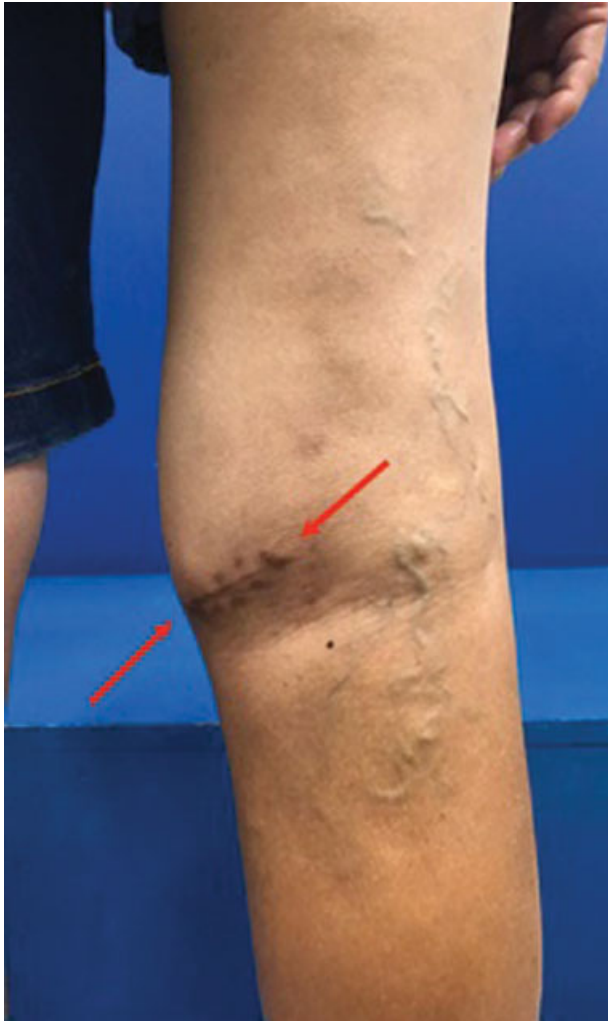
Fig. 2 Foto da mesma paciente da Figura 1 . Região posterior do joelho direito de uma paciente submetida a uma biópsia aberta com via de acesso inadequada. Observa-se cicatriz transversa que precisará ser ressecada por completo. O fechamento de pele poderá ser comprometido.

dos pulmões, o PET-CT muda o estadiamento quanto detecta metástases de diagnóstico duvidoso dentro ou fora dos pulmões. Além disso, o valor do standard uptake value (SUVmax) demonstrado no PET-CT pode prever não só a atividade biológica, como também o grau do tumor e por isso tornou-se um fator prognóstico útil na análise de sobrevivência de pacientes com SPM. O PET-CT também possui importante papel na avaliação da resposta à quimioterapia e no planejamento do volume da radioterapia. Como permite a avaliação prévia da agressividade do tumor, o PET-CT pode direcionar a realização de ressecções mais agressivas com margens adequadas e, por outro lado, pode evitar a realização de biópsias desnecessárias. 3,11,26