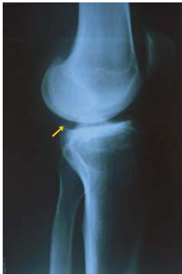
Fig. 1 Radiografia em perfil do joelho demonstrando anteriorização da tíbia em relação ao fêmur. Nota-se o osteófito posterior na tíbia, característico desta migração.

Consideraremos isoladamente as características de cada uma destas lesões; porém, elas ocorrem concomitantemente, podendo haver lesão meniscal com graus variáveis de lesões do osso subcondral e da cartilagem, ou qualquer outra associação de lesões.