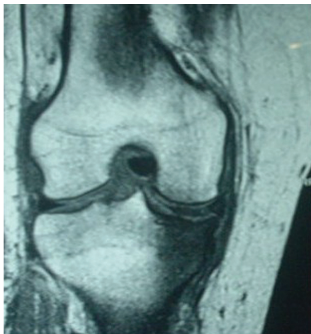
Fig. 3 Imagem de ressonância magnética(RM) com edema ósseo na tíbia, demonstrando lesão por fadiga.

O quadro clínico é progressivo, e depende das lesões intrínsecas. Em geral, inicia-se por uma dor aguda e importante, sem causa proporcional ao sintoma, 4 na região medial do joelho. O exame físico demonstra a posição em flexão e