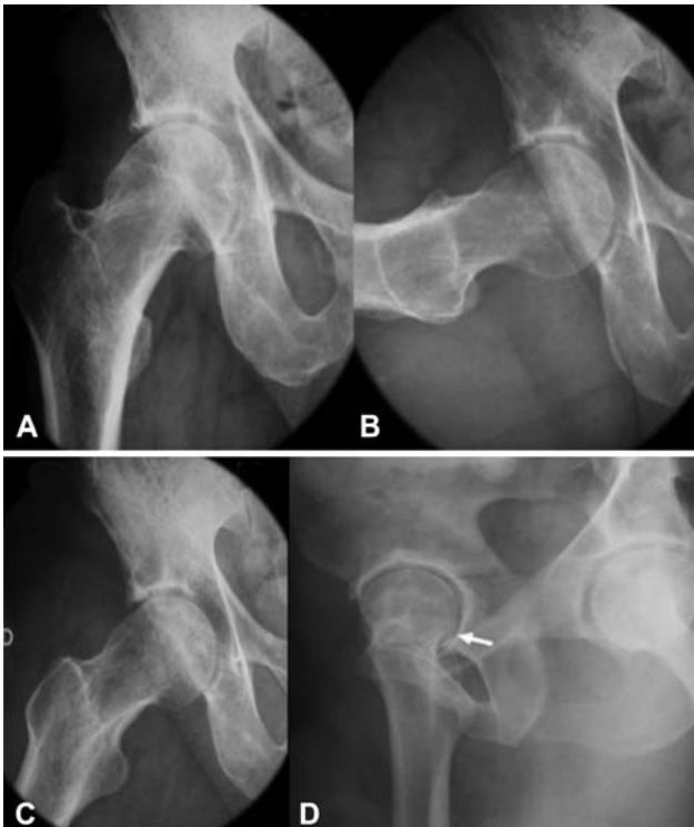
Fig. 3 Incidências radiográficas do quadril na pesquisa de IFA. (A) incidência anteroposterior. (B) incidência de Ducroquet. (C) Incidência de Dunn para visualização do came. Observe a retificação e a proeminência da região transição colo-cabeça. (D) imagem radiográfica da posição de Lequesne.

Sugere-se a realização de 5 incidências radiográficas para avaliação inicial do IFA: 1) AP de pelve; 2) Dunn com 45° de flexão do quadril e 20° de abdução em rotação neutra; 3) Lauenstein com o quadril entre 30° e 40° de flexão e 45° de abdução (planta do pé em contato com o joelho contralateral); 4) perfil de Ducroquet com flexão de 90° e abdução de 45°; e 5) falso perfil de Lequesne 35 (→ Fig. 3).