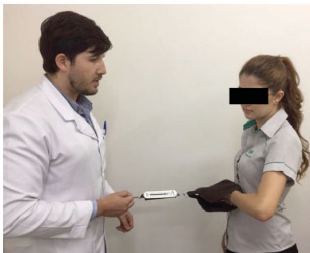
Fig. 1 Aferição da força no teste Belly Press .