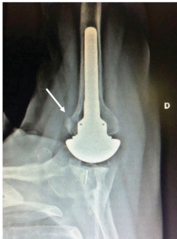
Fig. 3 Radiografia em perfil axilar demonstrando a consolidação do tubérculo menor após artroplastia total de ombro.