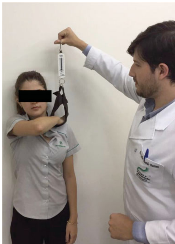
Fig. 2 Avaliação da força no teste Bear hug .

No Grupo A, utilizamos a ultrassonografia para avaliação da integridade do tendão do músculo subescapular, definidos como tendão normal (► Figura 4A ), ruptura de espessura total sem comprometer toda a extensão craniocaudal ou ruptura de