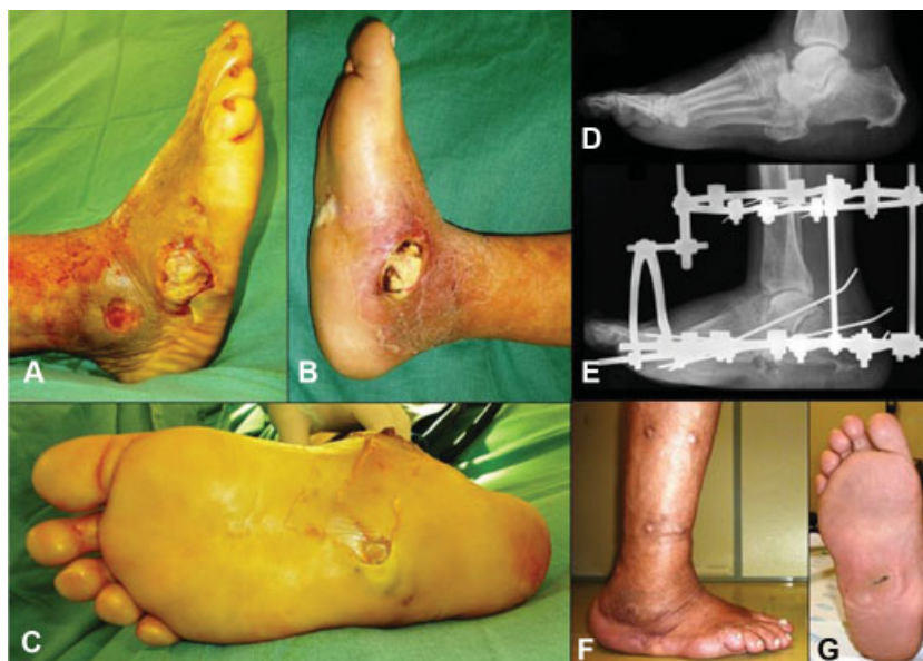
Fig. 1 Imagens lateral (A), medial (B) e plantar (C) do pé direito, mostrando a presença de múltiplas úlceras infectadas com necrose tecidual associada. Na imagem radiográfica pré-operatória, realizada na incidência lateral do pé, nota-se luxação talonavicular e saliência plantar do osso cubóide no mediopé (D). Após o debridamento cirúrgico e remoção do osso cubóide luxado, a imagem radiográfica na incidência lateral do pé mostra a estabilização da extremidade com o fixador externo circular (E). Seis meses após o tratamento foi possível evitar a amputação da extremidade e o pé encontra-se alinhado e livre da infecção e das úlceras (F e G).

Algumas infecções moderadas e todas as infecções profundas e graves necessitam de internação hospitalar imediata para início do tratamento o mais rápido possível a fim de reduzir o risco de amputação. 46,56 Nos casos graves, é mandatório realizar intervenção cirúrgica precoce voltada para drenar os abscessos profundos e remover, por meio de cuidadoso debridamento, tanto os tecidos moles desvitalizados quanto todo osso infectado e necrótico. Ênfase deve ser dada na recomendação para deixar a ferida operatória completamente aberta para permitir drenagem contínua e evitar a coleção de novo abscesso. 46,56 (→ Figura 1 ) Frequentemente, são necessárias múltiplas