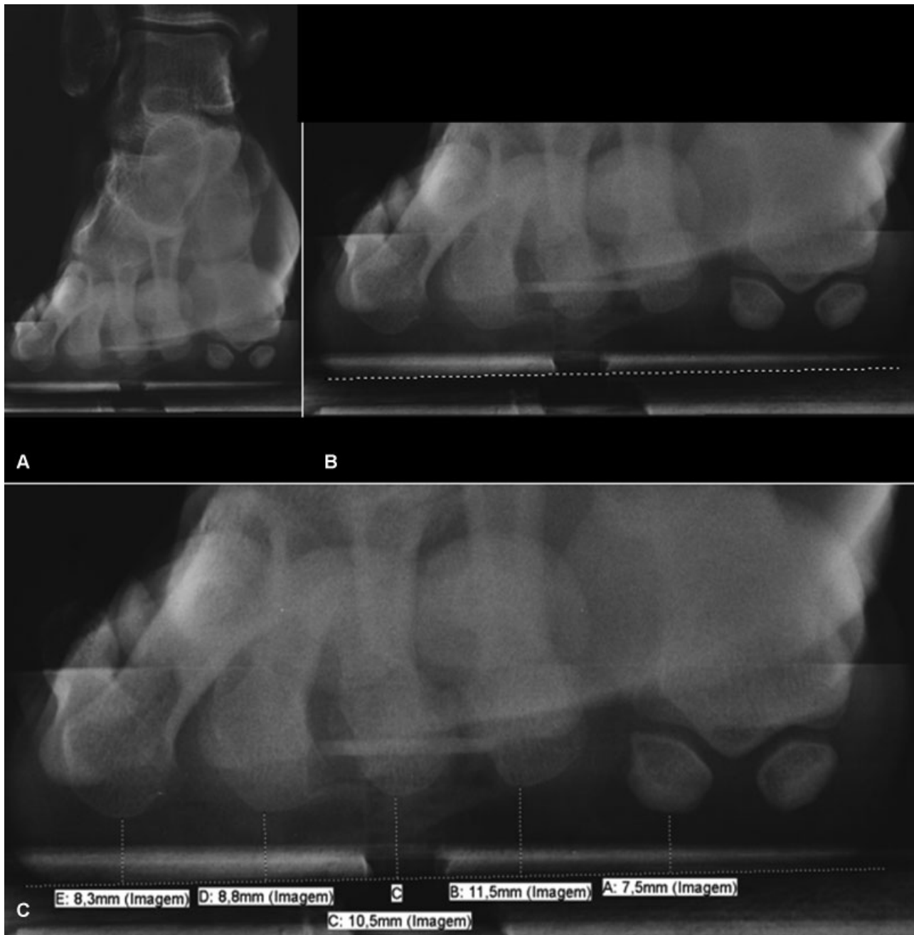
Fig. 3 Aspecto visual da radiografia axial com carga do antepé. (A) Imagem obtida permitindo a visualização de todo antepé; (B) Linha de apoio traçada, marcando o plano da carga do antepé; (C) A partir dos pontos mais plantares dos cinco raios medimos a distância à linha.