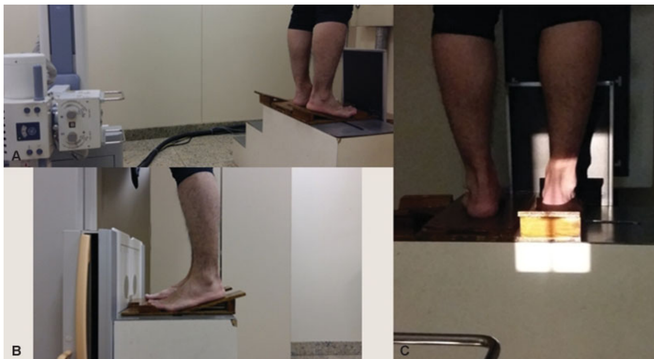
Fig. 1 Posicionamento do paciente para a aquisição da radiografia axial do antepé com carga. (A) Ampola radiográfica à 1 m de distância do filme; (B) Posicionamento do tornozelo em 20° de equino, com 10° de extensão dos dedos em relação ao apoio; (C) Área total radiografada.

Trinta e cinco indivíduos (70 pés) foram avaliados. Na fase inicial do estudo estávamos adequando tanto o posicionamento do dispositivo quanto a técnica radiográfica; dessa