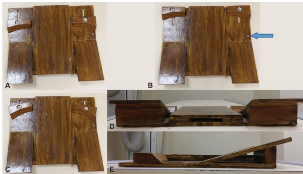
Fig. 2 Suporte de posicionamento para aquisição radiográfica. (A) vista superior com a rampa anterior na posição mais proximal; (B) Vista superior com a rampa anterior na posição mais distal. Seta azul indicando o posicionamento da cabeça do 5° metatarsal; (C) Vista superior com a rampa anterior rodada para acomodar os dedos; (D) Vista posterior, evidenciando o suporte central do dispositivo, para o posicionamento do pé contralateral ao exame; (E) Vista lateral, mostrando as rampas anterior e posterior.

forma, sete pés foram excluídos por má qualidade da radiografia, impossibilitando a avaliação.