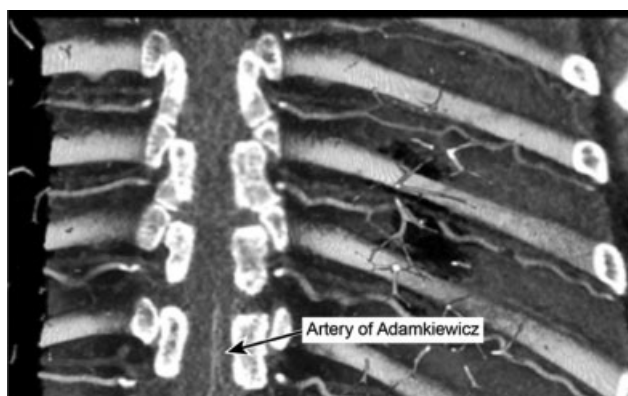
Fig. 2 Entrada da AAK pelo lado esquerdo ao nível de T11.

Dois observadores avaliaram independentemente os exames tomográficos usando a mesma estação de trabalho (Vitrea, Vital Images, Inc.). O observador 1 foi um radiologista com 15 anos de experiência na realização e interpretação de angiografias diagnósticas, e o observador 2 foi um cirurgião de coluna com 20 anos de prática. O observador 1 realizou uma avaliação aleatória