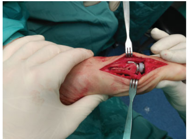
Fig. 1 Fotografia intraoperatória da artroplastia de 1MTP mostrando o encaixe correto dos implantes.

A mesma prótese (Metis, Newdeal SA; Integra Lifesciences ILS, Plainsboro Township, NJ, EUA) foi utilizada na artroplastia de 1MTP. Trata-se de uma prótese modular de titânio, não restritiva, com três componentes, não cimentada e revestida por hidroxapatita. Uma incisão medial do meio da falange ao meio do metatarso foi realizada para expor a primeira articulação metatarsofalângica. No preparo das superfícies articulares, osteófitos e cartilagens foram removidos e uma bunionectomia (quando necessária) foi realizada. Após a determinação do tamanho do componente metatarsico, o metatarso foi seccionado com a guia de corte e o implante foi testado. É importante destacar que a secção do metatarso foi realizada em todos os pacientes com index plus (primeiro metatarso mais longo do que o segundo metatarso) para que os dois ossos apresentassem o mesmo comprimento ( index plus minus ). A falange foi, então, preparada com mandril e o implante de tamanho apropriado foi escolhido e testado. A amplitude de movimento e a frouxidão