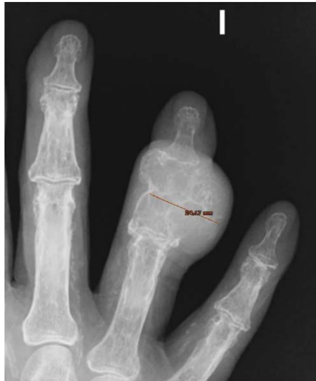
Fig. 2 Radiografía simple PA en la que se observa una lesión expansiva de la falange media del 4° dedo mano izquierda, observemos la modificación de tamaño y forma de la lesión de la misma localización vista 2 años antes.

Se realiza TAC helicoidal multicorte en la mano izquierda, para completar el estudio con resultado de lesión lítica muy expansiva que afecta a la falange media del 4° dedo de la mano izquierda, con adelgazamiento de la cortical ósea y zonas de destrucción cortical. Se observan pequeñas calcificaciones puntiformes en el interior de la lesión, en relación con la matriz condroide. Presenta unos diámetros aproximados de 21 \times 28 \times 25 mm. (diámetro anteroposterior, transversal y craneocaudal). Esos hallazgos, son sugestivos de encondroma protuberante. A pesar del aspecto agresivo de los encondromas protuberantes, dado el aumento de la lesión y la mayor destrucción cortical entre las radiografías de enero de 2011 y octubre del 2013, no se puede descartar una degeneración sarcomatosa. (► Figura 4 )