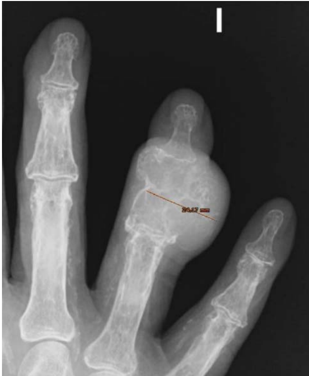
Fig. 3 Radiografía simple oblicua en la que se observa la lesión expansiva de la falange media del 4º dedo mano izquierda.

mide 6,8 cm de eje longitudinal, 3,5 cm de eje transversal y 3,4 cm de eje dorso-ventral. Se observa en la región media una tumoración de 4 cm de eje longitudinal, 3,5 cm de eje transversal que ulcera focalmente la superficie hacia la región lateral externa. La tumoración al corte es blanda, elástica, lisa, homogénea con áreas blanquecinas alternando con otras pardo rojizas que miden 2,7 cm de eje dorso-ventral y 2,8 cm en el transversal. Microscópicamente, se describe una tumoración de estirpe condroide, de aspecto