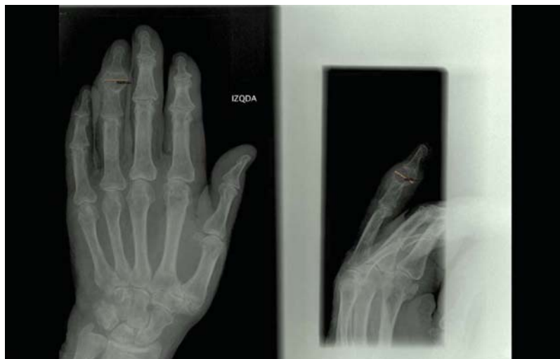
Fig. 1 Radiografía simple PA y oblicua en la que se muestra la lesión diagnosticada 2 años antes como encondroma con medida de la lesión en mm localizado en falange media de 4° dedo mano izquierda.

Al comentarlo con el paciente y con la familia, se decide la extirpación quirúrgica de la lesión, realizándose amputación reglada del 4° dedo de la mano izquierda. La descripción macroscópica de la lesión en anatomía patológica presenta una pieza de resección quirúrgica del dedo de la mano que