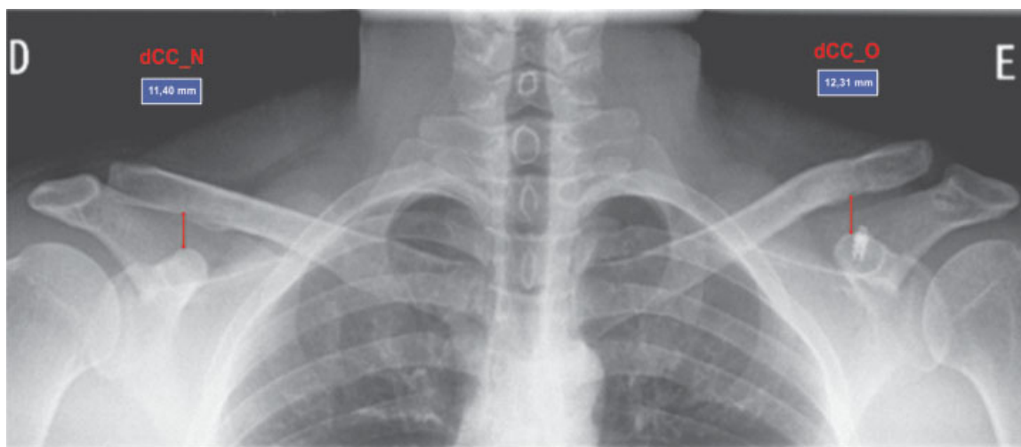
Fig. 1 Cálculo da distância coracoclavicular dos lados operado e normal (dCC_O/N: 12,31/11,40 = 1,07). Paciente com subluxação residual de 7%.

O procedimento foi realizado com o paciente na posição de cadeira de praia, sob bloqueio do plexo braquial e anestesia geral. Realizou-se incisão tipo sabre no sentido AP, iniciando a 1 cm medial à AAC, da borda posterior da clavícula até 1 cm superior à borda superior do processo coracoide. Quando intacta, a fâscia deltotrapezoidal foi incisada paralela às suas fibras. Em alguns pacientes, a critério do cirurgião, foi identificado o ligamento CA, que foi dissecado até a sua origem acromial e, então, seccionado e reparado para transferência ao terço lateral da clavícula, em fixação transóssea. Por meio de dissecação, a base do processo coracoide foi exposta, permitindo a inserção de duas âncoras metálicas de 4 mm cada, com 1 ou 2 fios de suturas não absorvíveis, adaptada conforme a técnica de Dal Molin et al. 6 As suturas foram passadas através de 2 furos feitos na clavícula com broca de 2,0 mm, com o objetivo de reproduzir a inserção anatômica dos ligamentos CCs: um orifício posteromedial para o ligamento conoide e, a 1 cm lateral a este, um orifício anterolateral de mesmo tamanho, para o trapezoide, a uma distância de 1 cm da AAC. Antes da aproximação CC com as suturas de ancoragem, a AAC foi reduzida anatomicamente: enquanto o assistente executava a manobra de estabilização da escápula em retração e abaixamento da