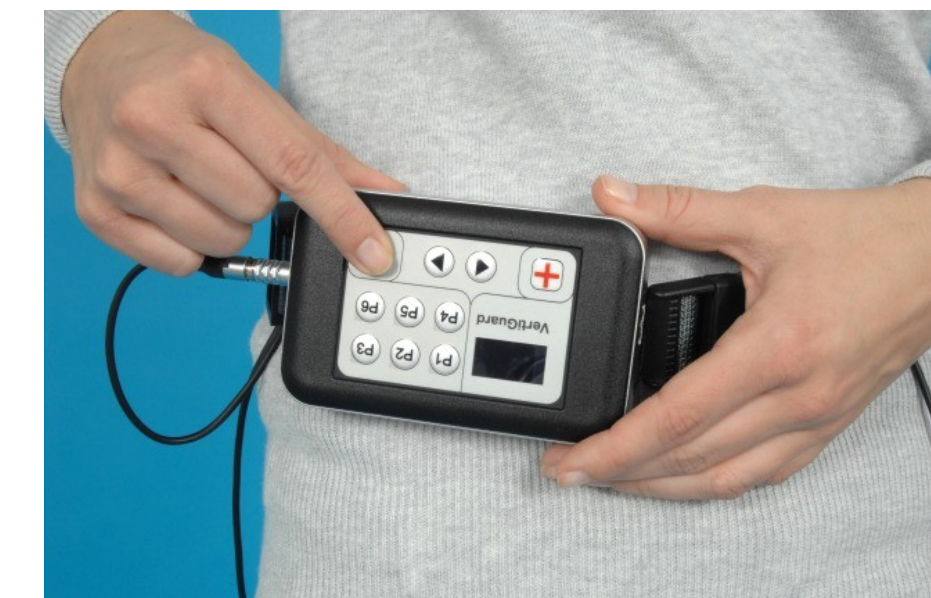
Abb. 2. Vibrotaktilen Neurofeedback mittels VertiGuard® RT

Ergebnisse: 120 von 190 gescreenten Patienten konnten in die Studie eingeschlossen werden, von denen 109 beide Therapien mindestens einmal erhielten. In der Gesamtgruppe reduzierte sich das gSBDT-Sturzrisiko von 56.1% auf 50.6%, der DHI von 44.1 auf 31.1. Parallel verbesserte sich die kognitive Leistungsfähigkeit (Trail Making Test, Differenz Teil B – Teil A) von 70.4s auf 56.9s, während die audiometrische Hörschwelle unverändert blieb. Die Kombinationstherapie war sicher und gut verträglich.