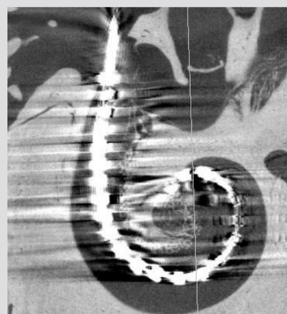
Abb. 2: Mikro-CT-Aufnahme nach der Insertion und elektrische Erwärmung der Formgedächtnislegierung

Die histologische Auswertung des Versuchs zeigte, dass eine Insertionstiefe von 360° und die gewünschte perimodiolare Lage des Elektrodenträgers erreicht werden konnten. Außerdem wurden keine thermischen Schäden an den Gewebestrukturen entdeckt.