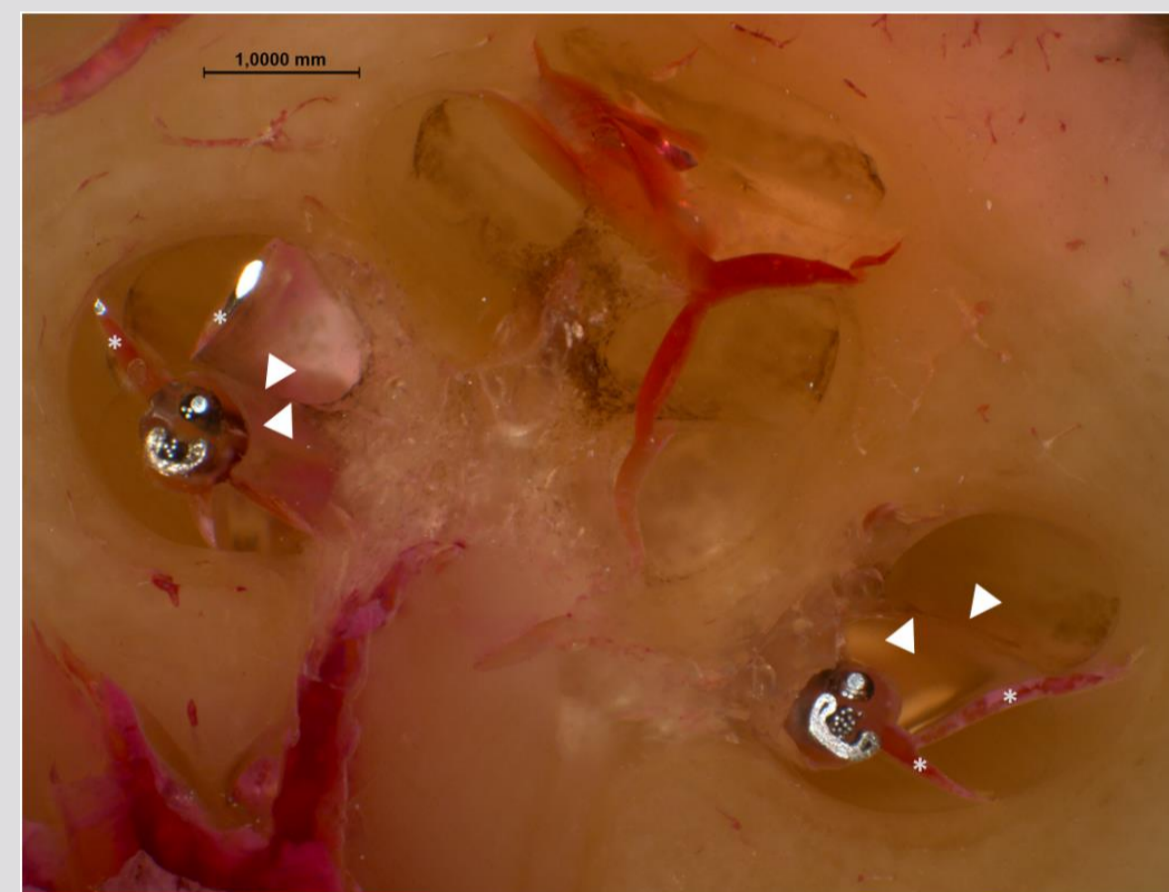
Abb. 3: Histologische Evaluierung zeigt intakte Basilar-membran (weiße Pfeile) nach der Insertion. Die weißen Punkte weisen auf die Artefakte durch die Präparation hin.