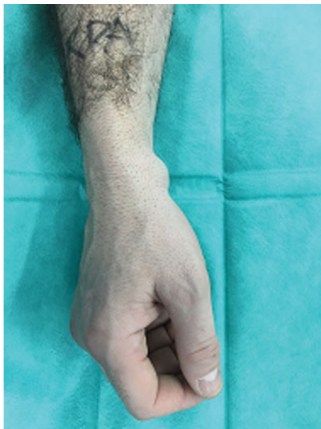
Fig. 2 Aspecto clínico habitual del ganglión volar de muñeca.

presentaban G.V.M. primario o recidiva con presencia de limitación funcional, dolor o problema cosmético y de más de 6 meses de evolución. Los criterios de exclusión fueron pacientes fuera del rango de edad y tiempo de evolución previamente establecido, infección activa, deformidad severa o secuelas de fractura previa o presencia de G.V.M. dependiente de vaina tendinosa. Un grupo de 21 pacientes consecutivos (12 hombres, 9 mujeres) con una media de edad de 42 años (rango 36–51) constituyeron la población a estudio, no hubo pérdidas de seguimiento.