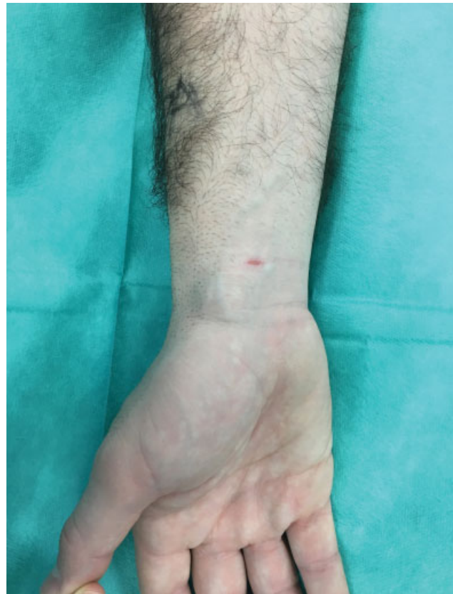
Fig. 1 Aspecto clínico habitual del ganglión volar de muñeca.

Desde Octubre de 2015 hasta Enero de 2018, se incluyeron todos los pacientes remitidos a la Unidad de Cirugía de Mano para valoración de G.V.M. Los criterios de inclusión son pacientes de edad comprendida entre 18 y 65 años que