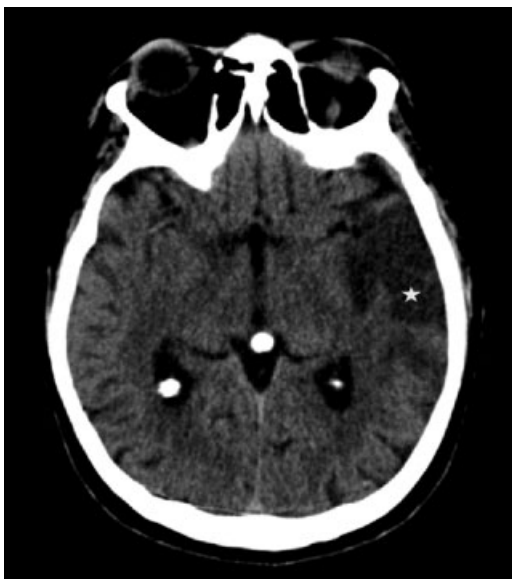
Fig. 2 El mismo paciente que en la figura 1 , cuatro días después. En el corte axial de tomografía de cerebro sin contraste, se reconoce hipodensidad en territorio temporal izquierdo (estrella blanca), con aplanamiento de los surcos regionales, como expresión de ACV isquémico en evolución.

una atenuación significativamente mayor (162 UH) que los trombos intraluminales (50–70 UH) y son redondeados u ovals en lugar de tubulares o lineales. 5