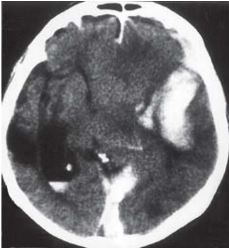
Figura 1 – TC mostrando associação de HSDI occipital, contusão temporal e hemorragia intraventricular.

Tratamento conservador foi instituído em sete casos (Figura 2). Cinco pacientes foram submetidos à drenagem cirúrgica de hematoma intracraniano associado: em um caso foi realizada craniectomia para drenagem de hematoma intraparenquimatoso; em dois, drenagem de hematoma subdural de convexidade; em um, tratamento de afundamento craniano e, em outro, craniectomia devida à lesão na base de crânio por ferimento por arma de fogo. Cinco pacientes evoluíram bem, quatro apresentaram paresia de predomínio crural e um outro desenvolveu distúrbio de micção. Dois pacientes evoluíram para óbito, sendo, em um, em virtude de múltiplas lesões intracranianas associadas (ECGI na admissão: 4) e, noutro, pelo ferimento provocado pela arma de fogo, com hematoma intraparenquimatoso associado (ECGI na admissão: 6).