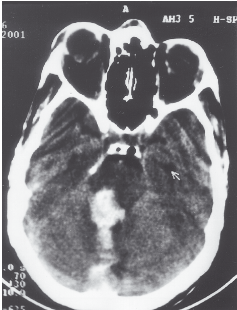
Figura 1 – TC apresentando extenso hematoma no hemisfério cerebelar direito.

varam-se fratura occipital direita e hematoma intraparenquimatoso no hemisfério cerebelar direito com compressão do tronco cerebral; ventrículos de tamanhos normais e simétricos (Figura 1). A ressonância magnética (RM) revelou lesão hiperdensa no hemisfério cerebelar direito com compressão do tronco cerebral (Figura 2).