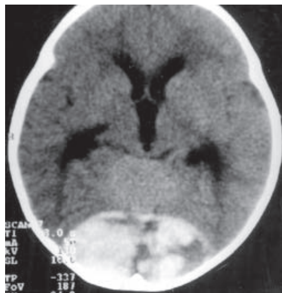
Figura 2 – Tomografia computadorizada: hematoma extradural bilateral na região occipital.