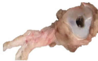
Grupo 2: Paralelo

Fig. 4 Se observa el fallo macroscópico de una muestra representativa para cada grupo de estudio. En el grupo 1, todas las muestras sufrieron avulsión central, preservando las fibras perimetrales. En el grupo 2, todas las muestras sufrieron una división longitudinal del tendón.