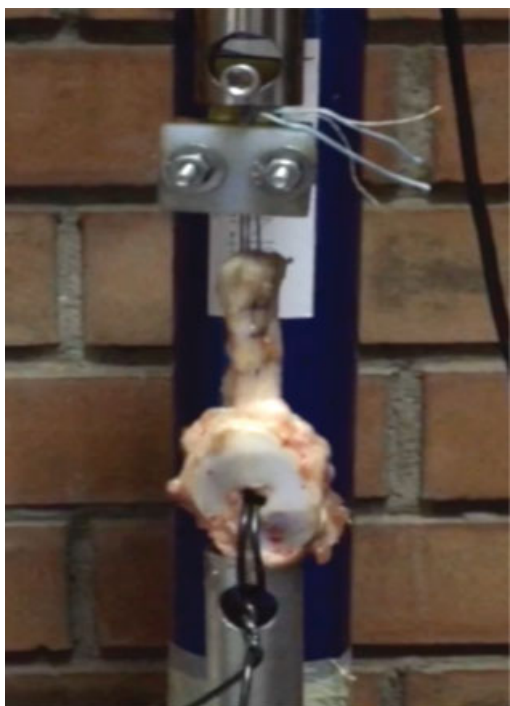
Fig. 2 Muestra fijada a la máquina de tracción. Las muestras fueron ancladas al soporte móvil de la máquina de tracción a través de un pasador trans-patelar para asegurar la firmeza del constructo. Las suturas del Bunnell fueron ancladas en un soporte fijo.