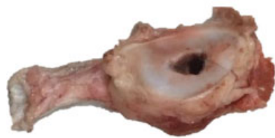
Grupo 1: Perpendicular