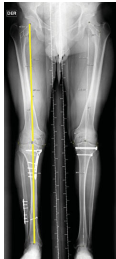
Fig. 4 Telerradiografía de extremidades inferiores postoperatoria con eje mecánico derecho corregido a neutro (0°).

favorablemente, dado de alta al segundo día postoperatorio con carga mínima, aumentando la carga progresivamente hasta lograr carga completa a las 12 semanas postoperatorias. Al control de imágenes en las 8 semanas post operatorias