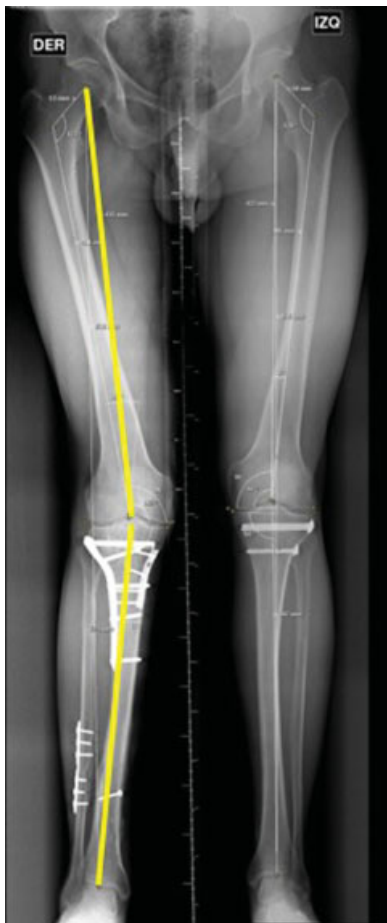
Fig. 2 Telerradiografía AP de extremidades inferiores, eje mecánico con 11° de valgo a derecha y de 1° a izquierda.