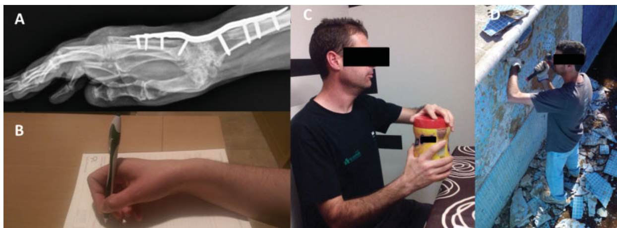
Fig. 4 (A) Artrodesis total de muñeca con placa AO/ASIF (Synthes, Paoli, Pennsylvania, USA). (B, C, D) Espectro de actividad física del paciente, desde tareas finas hasta altamente demandantes.

El tratamiento con prótesis MF de efecto bisagra, ha demostrado una alta eficacia y satisfacción por parte de los pacientes. Creemos que esa cirugía siempre debe ir acompañada de determinados gestos para una correcta realineación del aparato extensor. Además, se debe tener en cuenta el estado de la muñeca, que podrá precisar un tratamiento asociado antes o después.