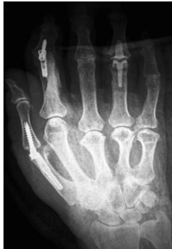
Fig. 3 Procedimientos combinados para mantener una pinza estable y una presa funcional de la mano. Se observa artrodesis MF del pulgar con sistema XMCP™. Artrodesis IFP del segundo dedo con sistema APEX™ (Extremity Medical, Parsippany, NJ. USA). Prótesis de carbón pirólitico (Integra®) en cuarto dedo.

los implantes no constreñidos tienden menos a la inestabilidad rotatoria y desviaciones laterales. 45