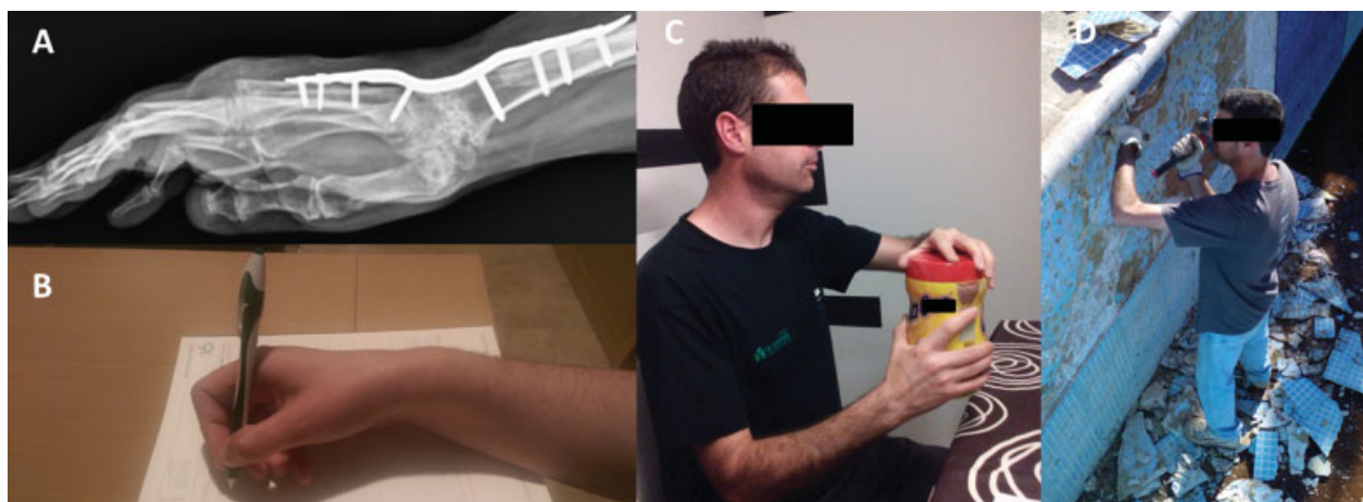
Fig. 4 (A) Artrodesis total de muñeca con placa AO/ASIF (Synthes, Paoli, Pennsylvania, USA). (B, C, D) Espectro de actividad física del paciente, desde tareas finas hasta altamente demandantes.

El tratamiento con prótesis MF de efecto bisagra, ha demostrado una alta eficacia y satisfacción por parte de los pacientes. Creemos que esa cirugía siempre debe ir acompañada de determinados gestos para una correcta realineación del aparato extensor. Además, se debe tener en cuenta el estado de la muñeca, que podrá precisar un tratamiento asociado antes o después.