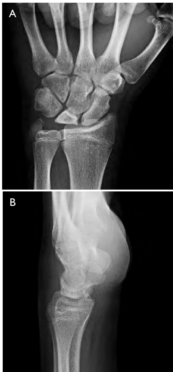
Figura 1. Radiología simple al comienzo de los síntomas del paciente. A. Radiografía anteroposterior en la que se observa esclerosis del semilunar y pérdida de altura (0,46 cm). B. Radiografía lateral en la que se observa ángulo radioescafoideo de 54°.

del carpo mientras se da tiempo a la revascularización del semilunar.