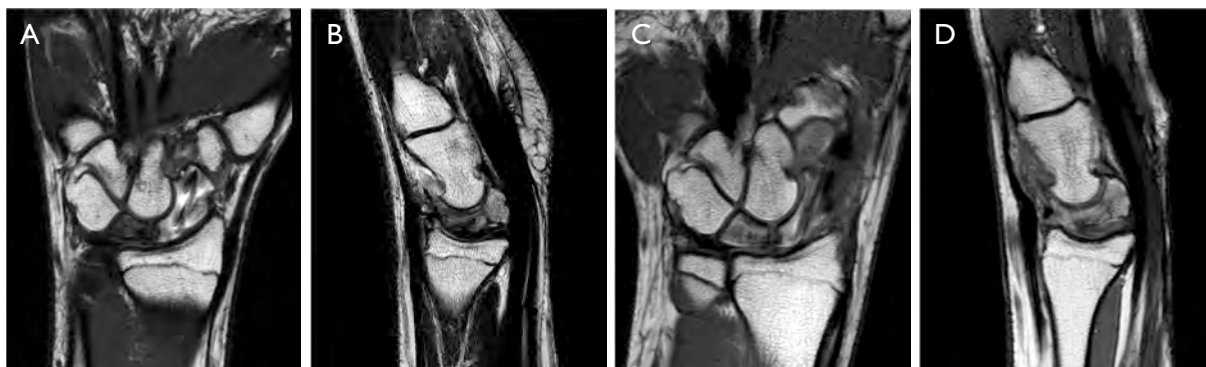
Figura 4. Estudio mediante RMN, se observa una disminución del edema óseo y zona de necrosis en el semilunar: A y B . 15 semanas tras la intervención. C y D . 24 semanas tras la intervención.

En el presente caso se apreció en la radiografía simple un semilunar escleroso de 0,46 cm de tamaño, una altura del carpo estimada con el índice de Youm en 0,48 y un ángulo radioescafoideo de 54°. En la resonancia magnética se observó un cambio de señal