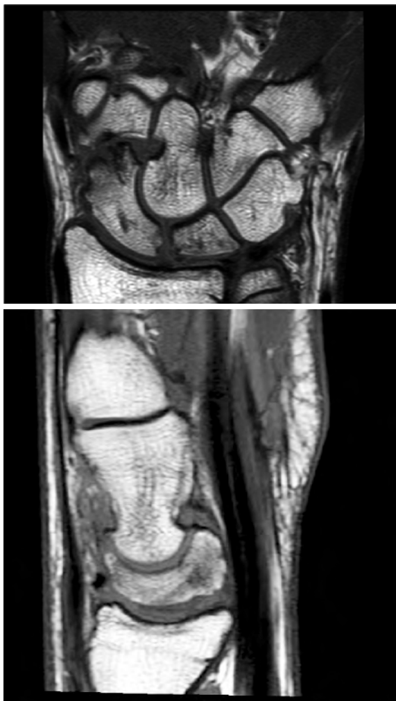
Figura 5. Estudio mediante RMN al año de la intervención quirúrgica. Se observan signos de buena recuperación con disminución de la zona de necrosis y normalización de la señal ósea.