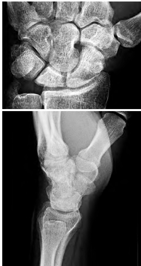
Figura 6. Radiografías simples a los dos años de la intervención quirúrgica.

en el semilunar que indica las áreas de necrosis. Por tanto, se clasificó al enfermo como estadio IIIA según Lichtman (colapso del semilunar con conservación de la altura y la alineación del carpo).