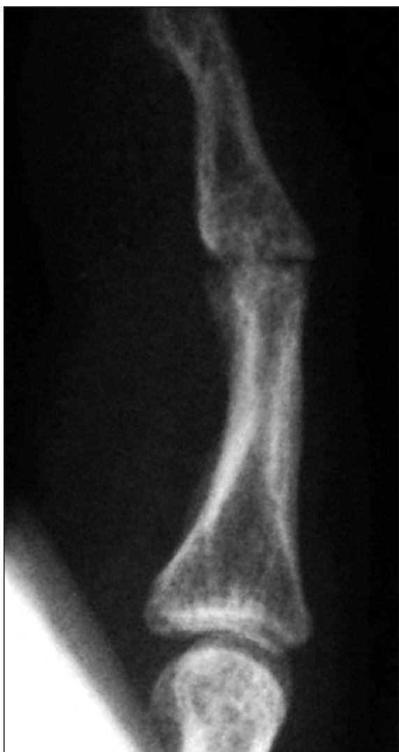
Figura 3. Tratamento de artrite pós-traumática. O Rx de perfil mostra estado de pseudartrose pós-artrodese IFD do 5º dedo da mão direita com fios Kirschner. O doente encontra-se assintomático e retomou o trabalho às 17 semanas.

complicações e pseudartrose, o que vai de encontro a outros estudos previamente publicados 1,2 . Comparativamente, neste estudo o Acutrak® demonstra elevada taxa de consolidação sendo que esta ocorre em todos os doentes até às 8 semanas. Paralelamente, não apresenta complicações e permite um rápido retorno laboral ou a atividades prévias, entre as 4-8 semanas, também de acordo com a literatura.