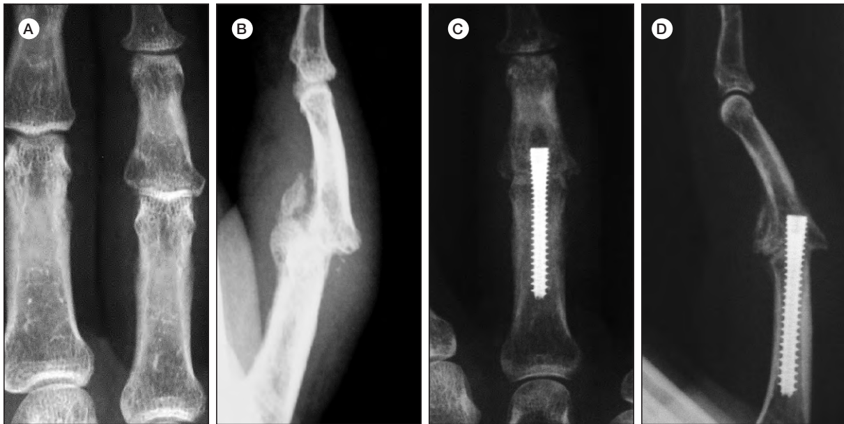
Figura 2. A-B) Rx de face e perfil pre-operatório de doente do sexo masculino de 55 anos com história traumática do qual resultou fractura-luxação IFP do 4º dedo esquerdo. C-D) Rx pós-operatórios de artrodese com parafuso Acutrak® em abril 2011. Consolidou e retomou o trabalho às 4 semanas.

Foram avaliados os seguintes parâmetros: consolidação e tempo, complicações, tempo de retorno laboral ou a atividades prévias.