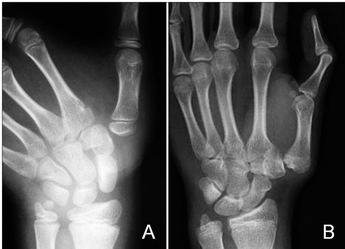
Figura 1. A: Luxación TM en un niño de 10 años. B: Aspecto 6 años más tarde.

En una niña de 9 años, cuyo traumatismo había ocurrido dos semanas antes, era muy llamativa en la exploración inicial realizada por nosotros, el resalte que se producía en la TM al hacer el