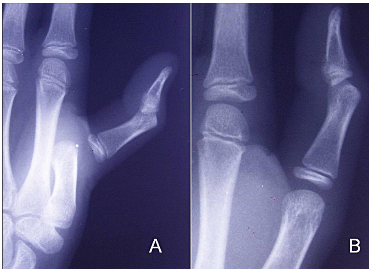
Figura 2. A: Luxación MCF del pulgar. B: Reducción cerrada.

RM nos ayuda a visualizar la presencia de esta interposición, y en consecuencia a decidir si es precisa la cirugía o por el contrario es suficiente el tratamiento mediante inmovilización. Más raramente, se producen lesiones del ligamento colateral radial, pero también en este tipo están más frecuentemente asociadas a un fragmento óseo epifisario.