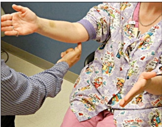
Figura 2. El examinador rasca sobre el nervio a explorar.

Se agrega como complemento de esta prueba el cloruro de etilo ( Figura 4 ), sustancia utilizada para anestesiarse de forma temporal la piel cuando se van a colocar catéteres intravenosos o en tratamientos de síndromes miofasciales. Existen lugares en donde el acceso al cloruro de etilo no es fácil, por lo que valdría la pena valorar si se puede obtener la misma respuesta con xilocaina