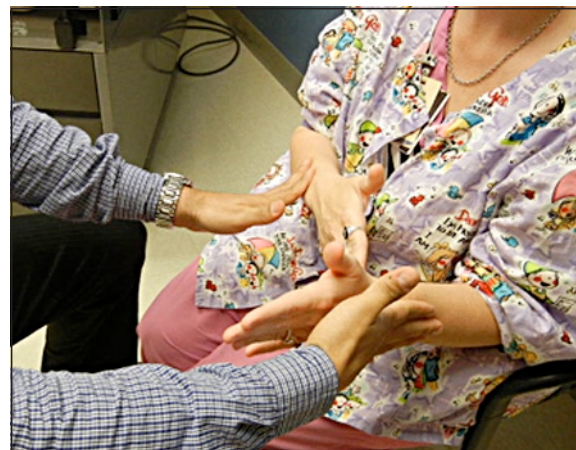
Figura 7. Estos sitios previamente negativos, ahora serán positivos.

Tradicionalmente se utiliza para diagnosticar las neuropatías compresivas el examen clínico que incluyen pruebas como Tinel, Phalen y Durkan, junto con los estudios de electrodiagnóstico 16 . Otras maniobras de provocación pueden utilizarse para complementar el armamento diagnóstico 17 . En el estudio realizado por Mackinnon y Cheng 8 se demostró la utilidad y fiabilidad de la prueba de colapso por rascado en pacientes con electromiografía positivas, y se comprobó que esta prueba tiene una mayor sensibilidad ( p < .001 ) que la prueba de Tinel. La exactitud fue de 82% para diagnosticar túnel del carpo y de 89% para el túnel cubital. Existe una curva de aprendizaje para esta prueba en general