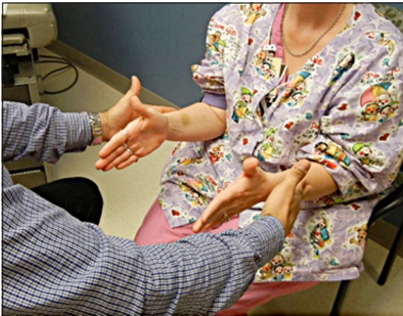
Figura 1. El examinador sentado frente al paciente prueba la fuerza del paciente para establecer una basal, antes de realizar el rascado.

sión nerviosa mientras el paciente se resiste a una rotación bilateral interna de los hombros ( Figura 2 ), Si el paciente tiene una neuropatía compresiva, se obtiene una momentánea pérdida de la resistencia muscular ( Figura 3 ). La ventaja es que esta prueba no depende de los datos subjetivos que pueda aportar el paciente y si depende de los datos objetivos que el examinador pueda encontrar.