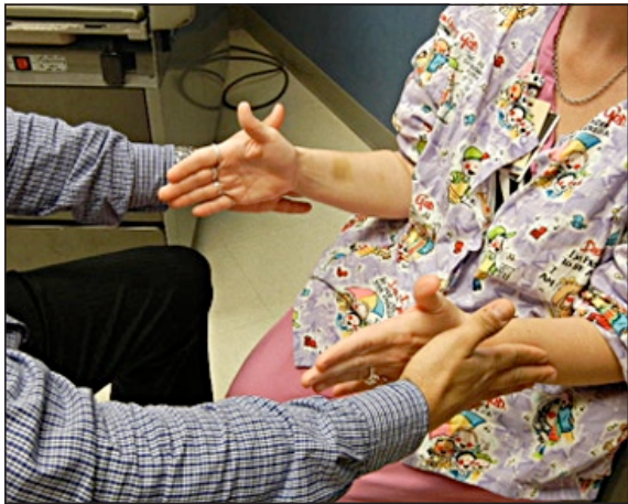
Figura 5. Después de haber aplicado el cloruro de etilo, se rasca nuevamente sobre la zona previamente examinada y el examen ahora será negativo, eso significa que el paciente no colapsará, puesto que ya no existe estímulo cutáneo.

colapsan con mayor facilidad y muchas veces aparecen puntos en zonas donde no colapsaban antes (Figuras 6 y 7).