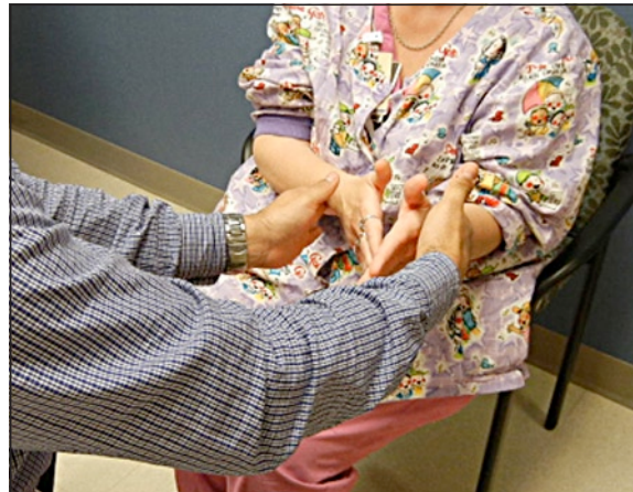
Figura 3. Se repite la aplicación de la fuerza al paciente y si existe una compresión nerviosa, este va a «colapsar».

en spray. La razón de aplicar cloruro de etilo, es para corroborar la prueba y localizar nuevos sitios de colapso.