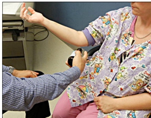
Figura 4. Cuando se quiere corroborar la prueba o cuando se quieren buscar sitios secundarios o subclínicos, se aplica cloruro de etilo en el sitio donde el rascado dio positivo previamente.

Una vez anestesiada la zona esta ya no colapsa puesto que ya no se propaga el estímulo cutáneo ( Figura 5 ). Lo que se encuentra a continuación es que los puntos de colapso secundarios ahora